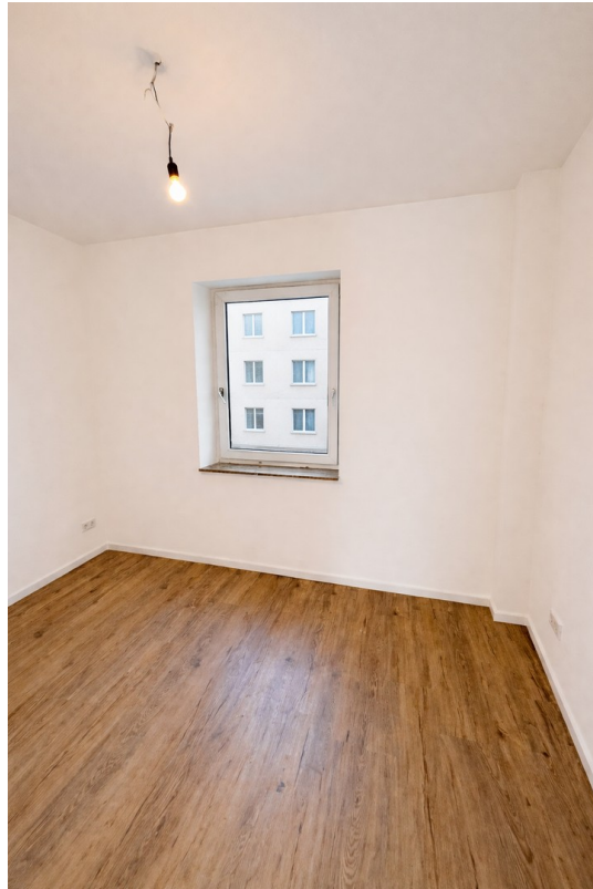
Ruhiges Schlafzimmer mit Blick