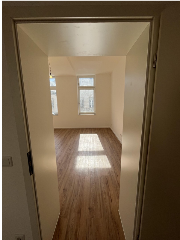
Heller Wohnraum mit angenehmer