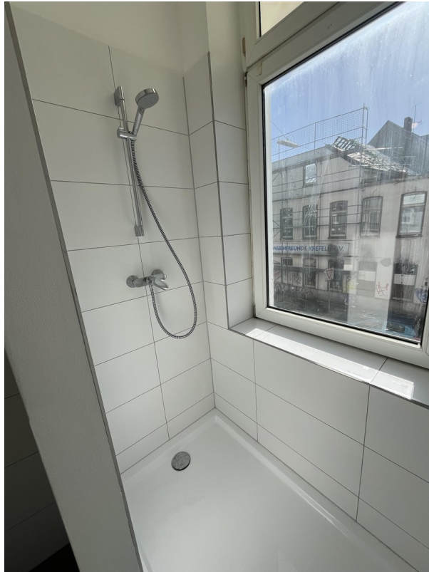
Moderne, großzügige Dusche