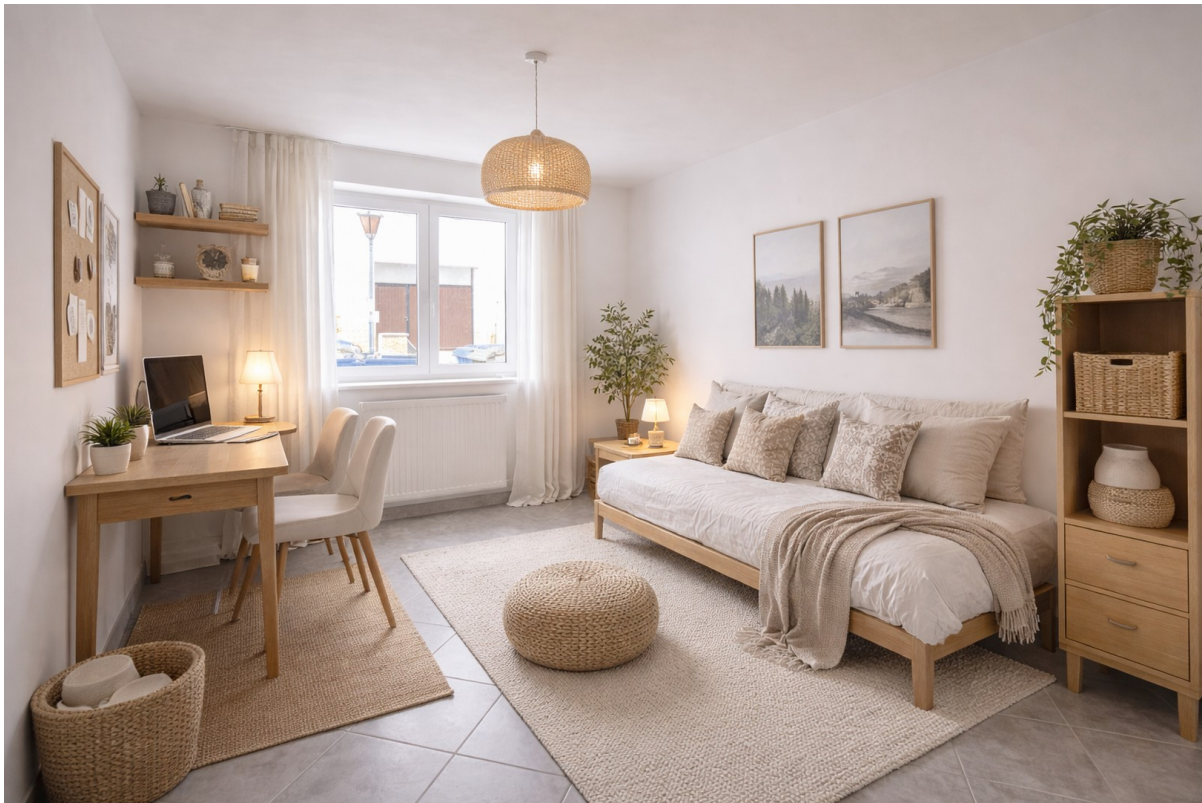
Arbeitszimmer - Wohnbeispiel