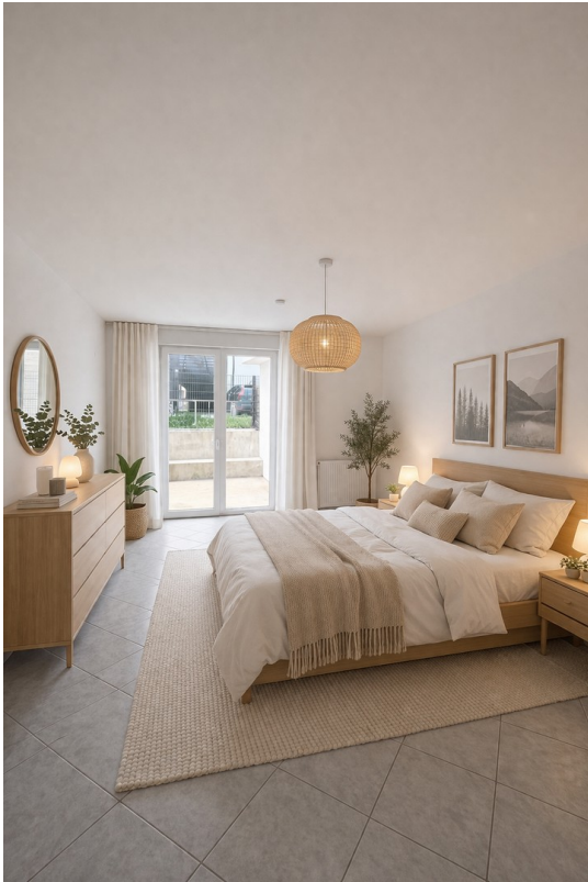
Schlafzimmer - Wohnbeispiel