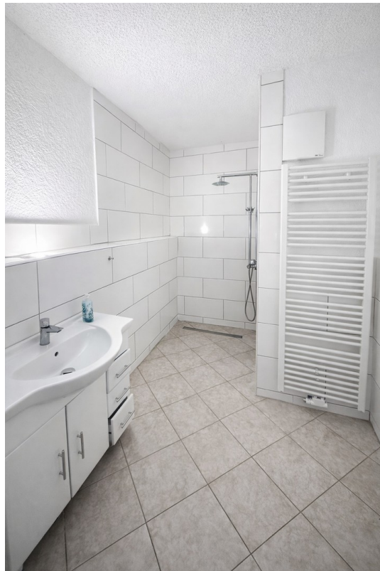
Bad 2 / barrierefreie Dusche