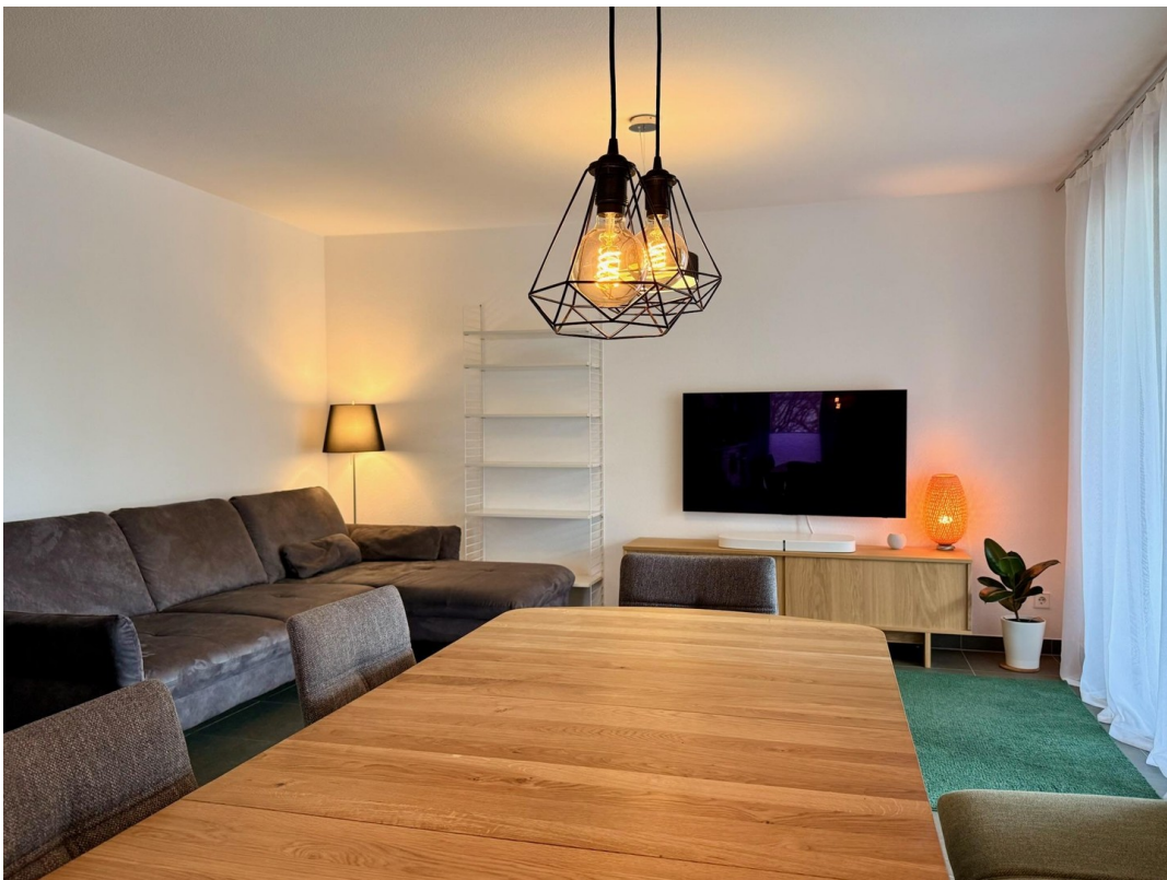
Wohnzimmer und Essbereich