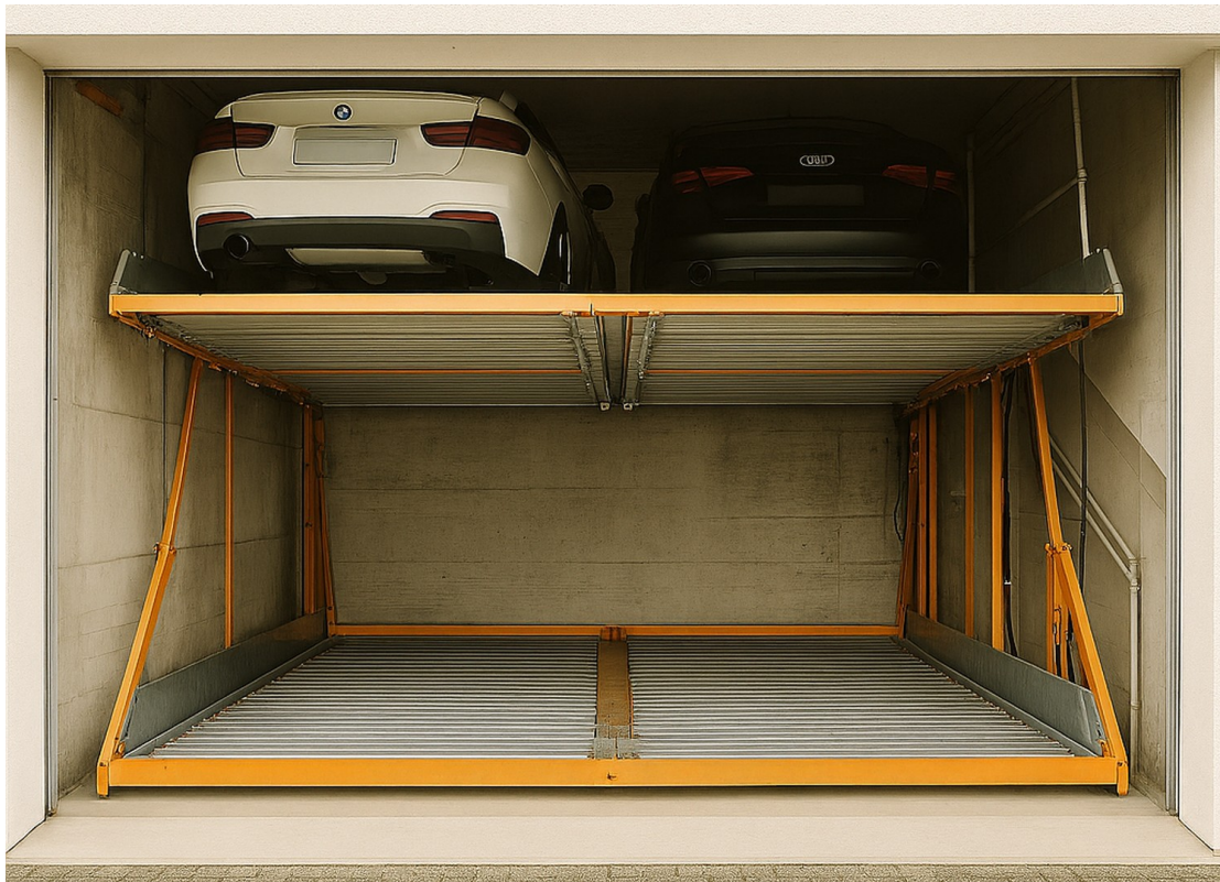
Doppelparker rechts unten