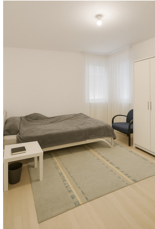
Schlafzimmer - ohne Möbel