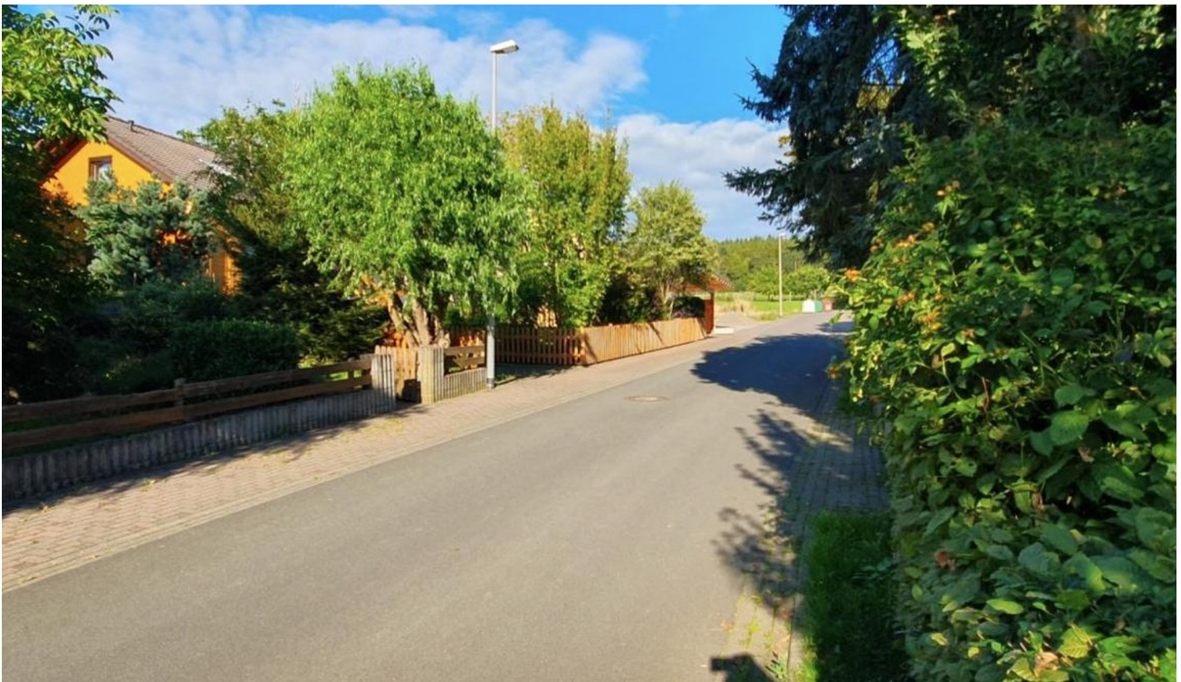
Straße m. Blick auf Grundstück