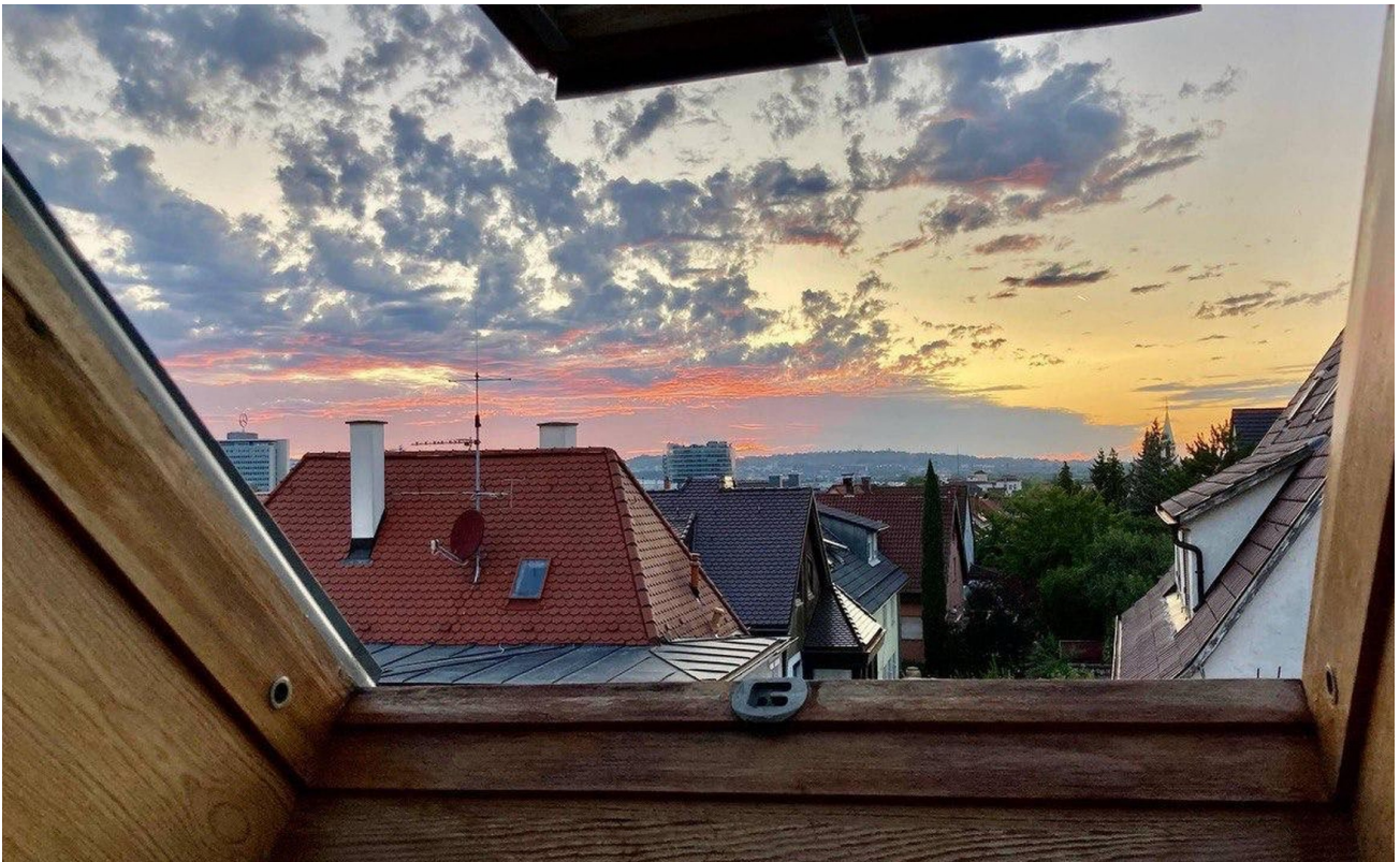
Ausblick aus der Wohnung