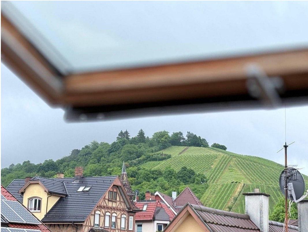
Ausblick aus der Wohnung