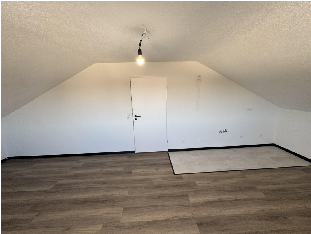
Wohnzimmer (offene Küche)