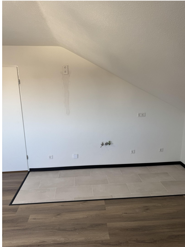
Wohnzimmer (offene Küche)