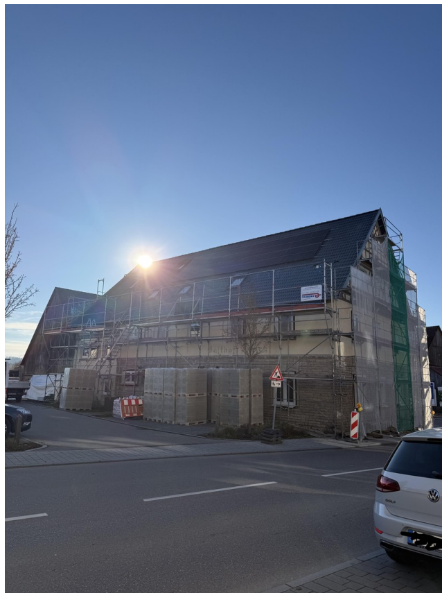
Ansicht Nord West