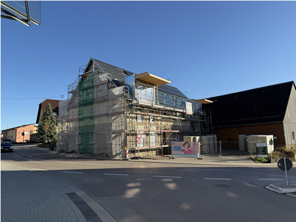
Außenansicht von Nord-Ost