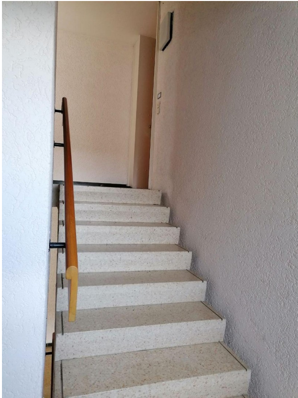
Treppe zu Wohnung 8.OG