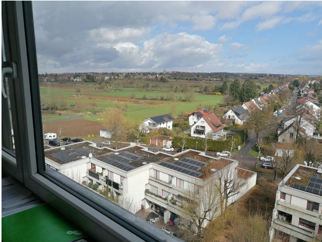
Blick aus dem Kinderzimmer