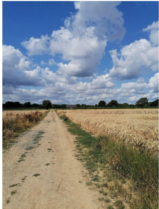
Die Felder hinter dem Haus