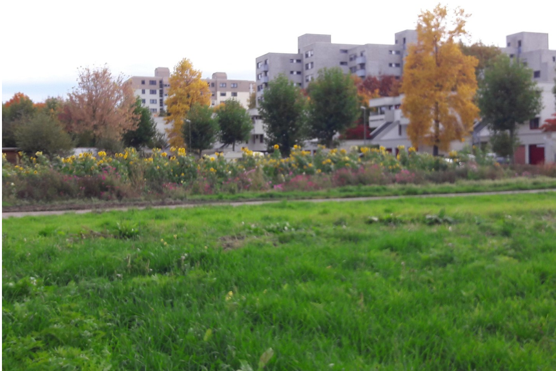
Blick auf die Wohnanlage