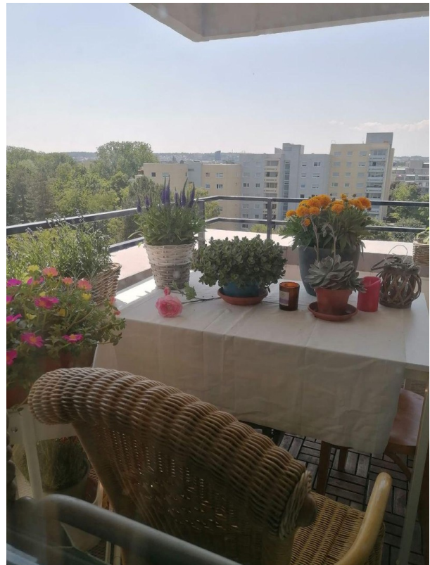
Blick 1 vom Balkon