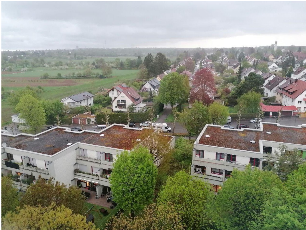
Blick aus dem Schlafzimmer