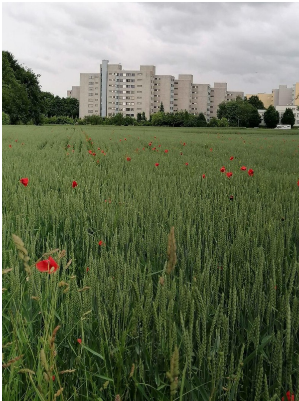
Blick auf die Wohnanlage