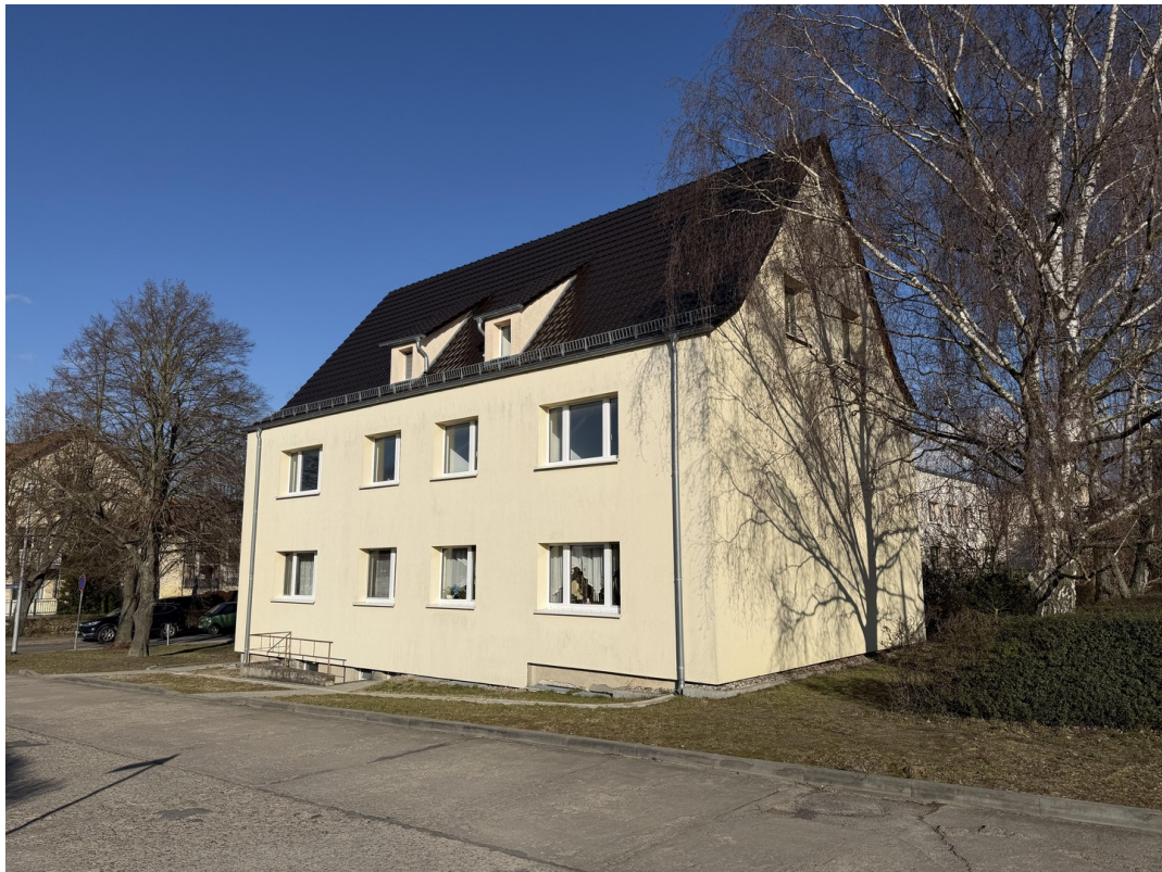
Außenansicht Birkenstr. 1