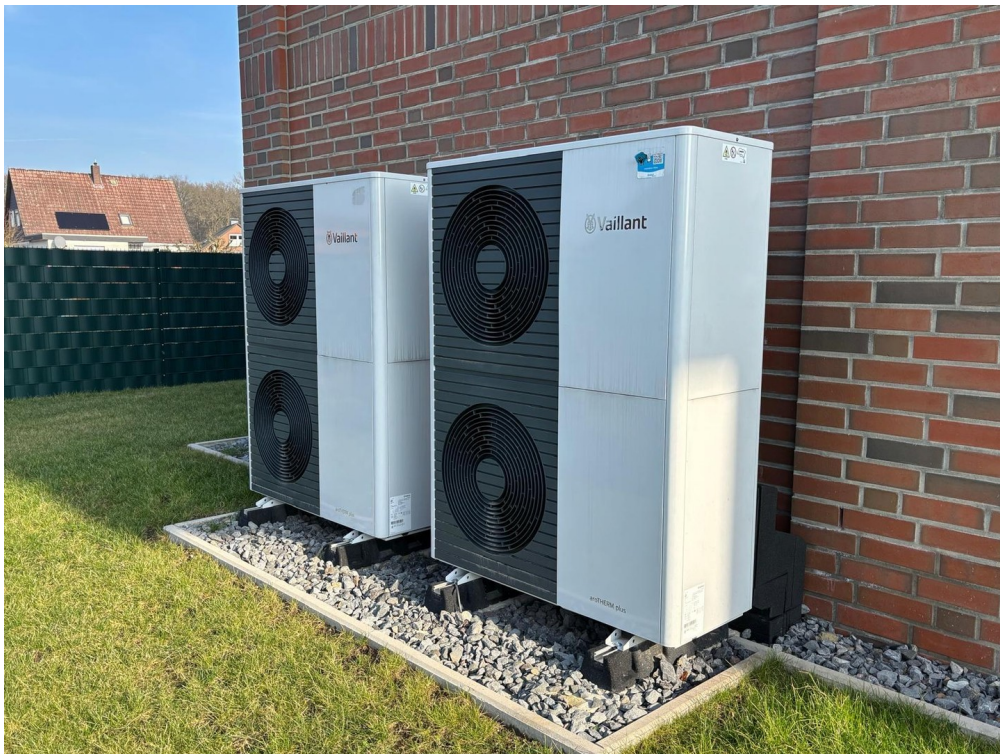
Beheizung des Objektes