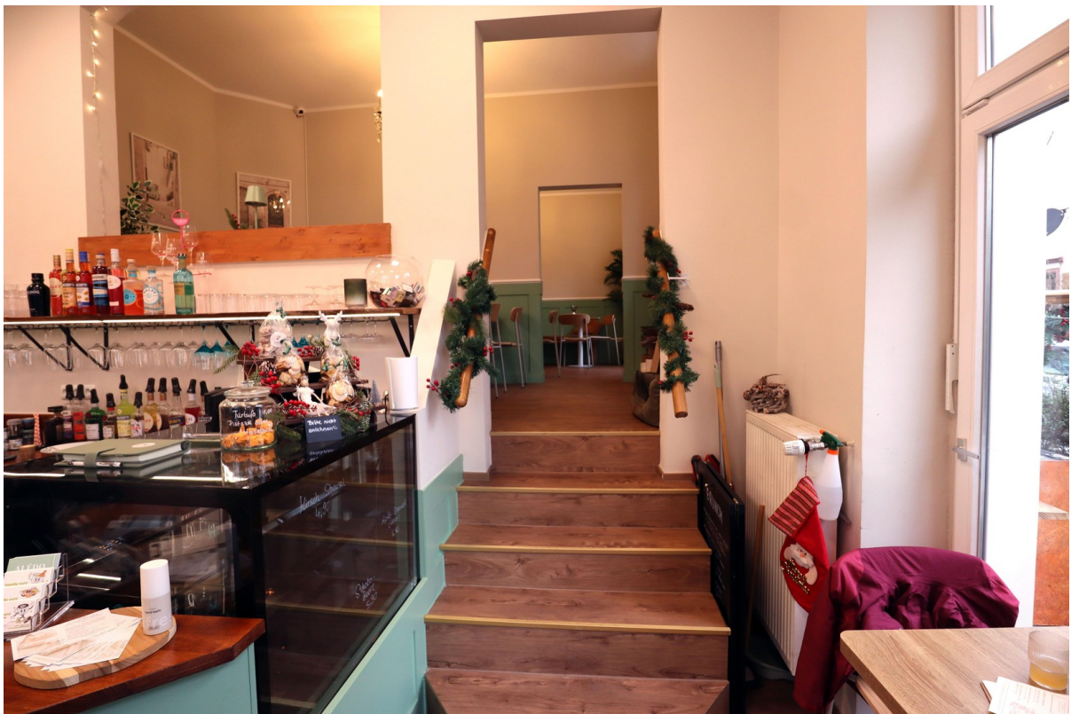
Aufgang zum Sitzraum