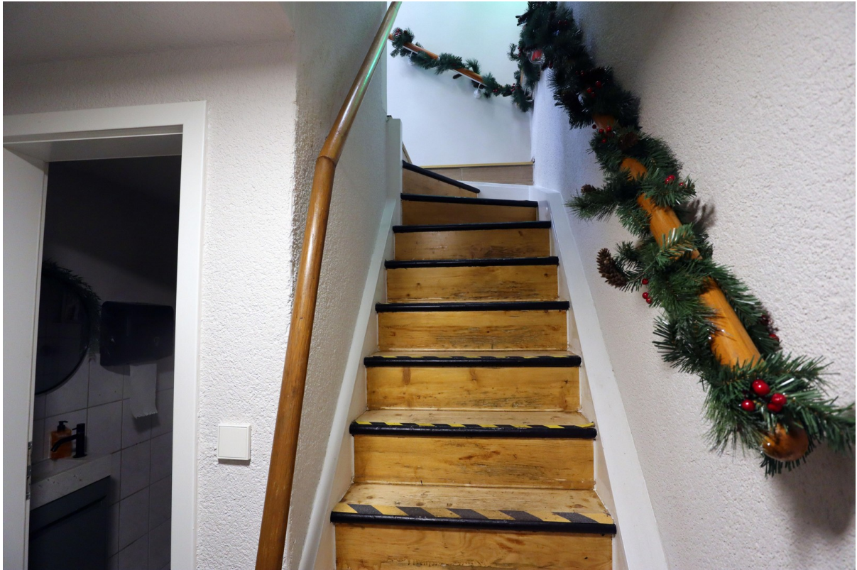
Treppe zum UG