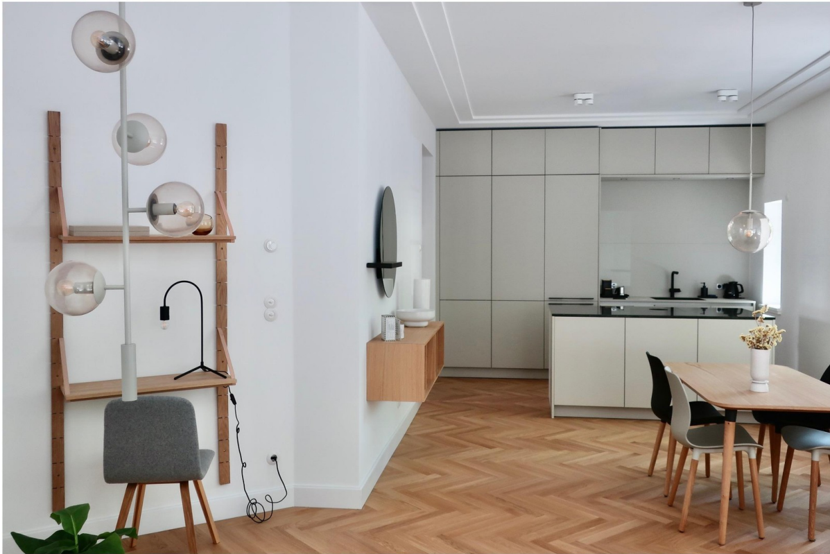
Küche (voll ausgestattet)