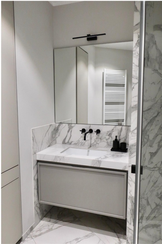
Bad mit Einbauschränk und Dusch