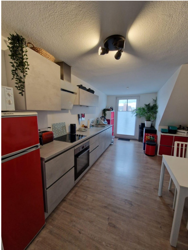
Küche mit Zugang zum Balkon