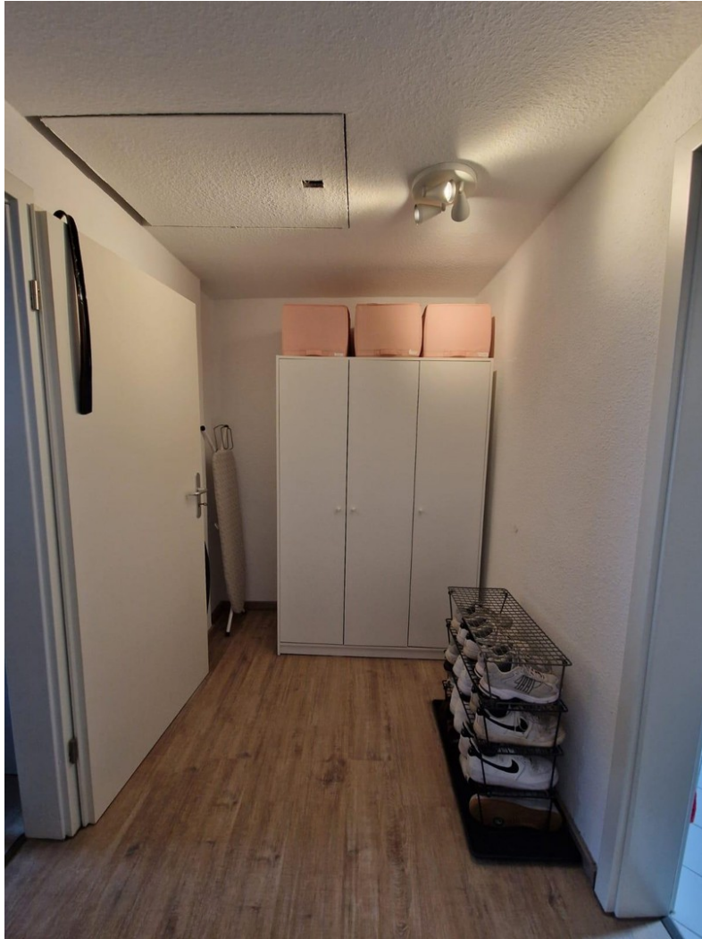
Diele zum Bad und Schlafzimmer