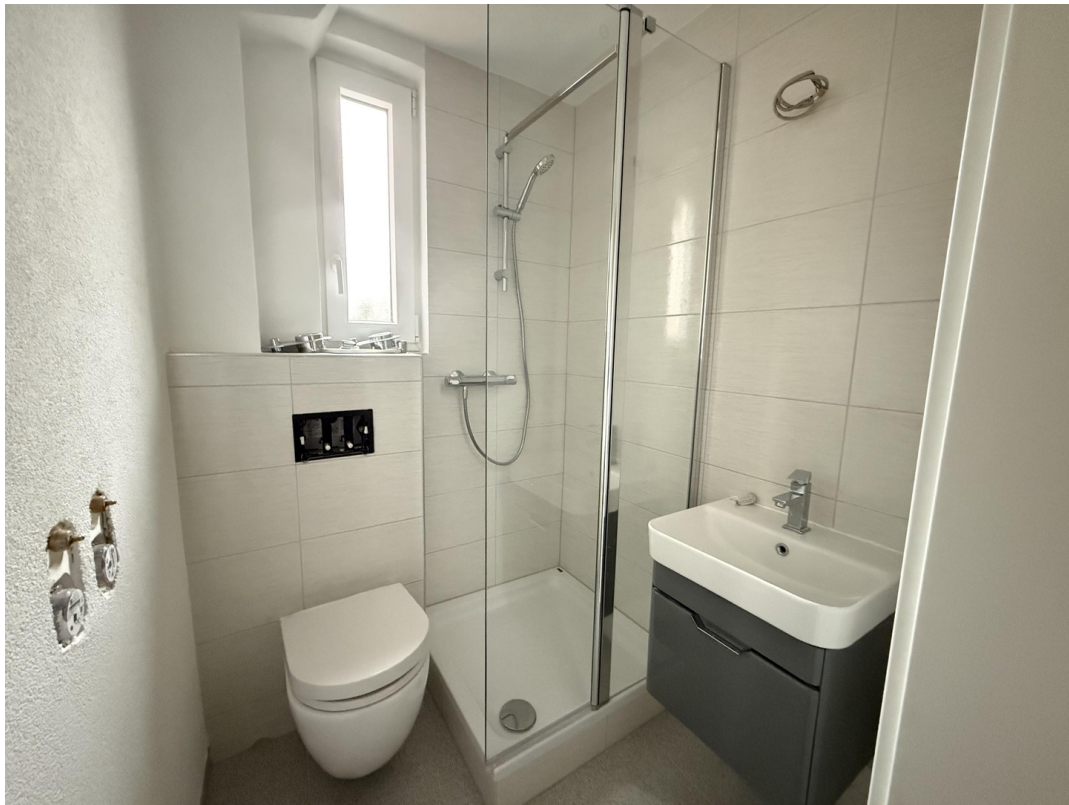
Badezimmer (untere Etage)