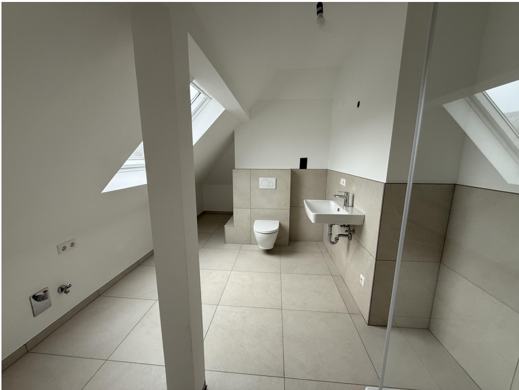
(Badezimmer (obere Etage))