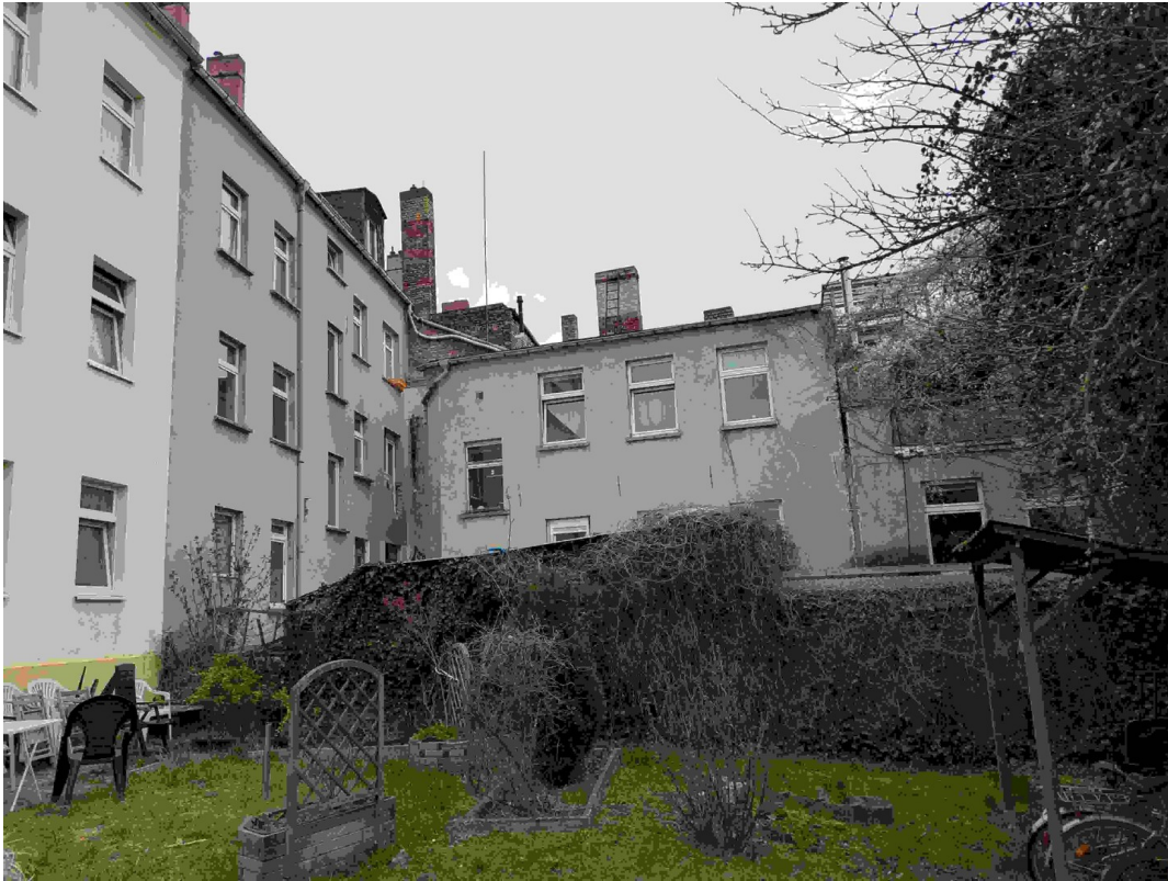
Ansicht von hinten