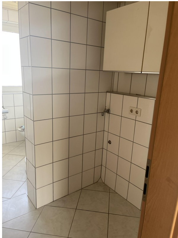
Bad Anschluss Waschmaschine