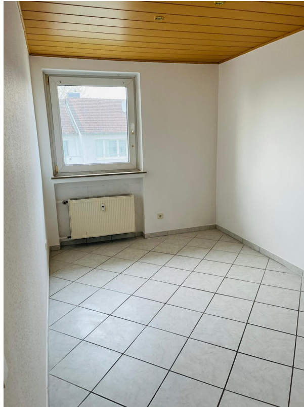
Kinderzimmer/ frisch renoviert