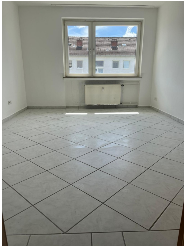
Schlafzimmer frisch renoviert