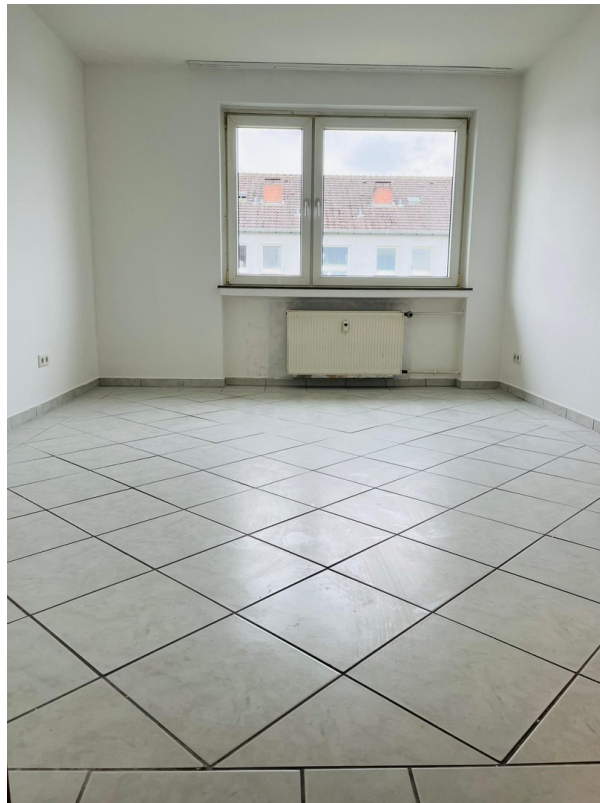
Schlafzimmer frisch renoviert