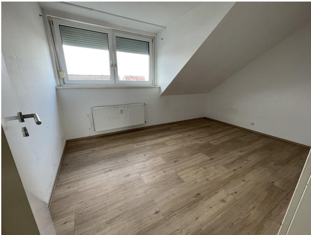
Kinderzimmer/ Büro/ Gast