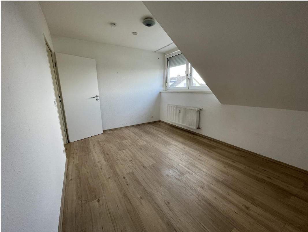
Kinderzimmer/ Büro/ Gast