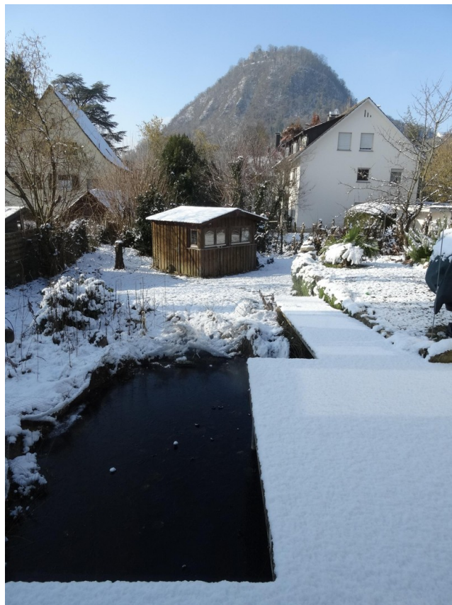
Teich, Gartenhaus im Winter