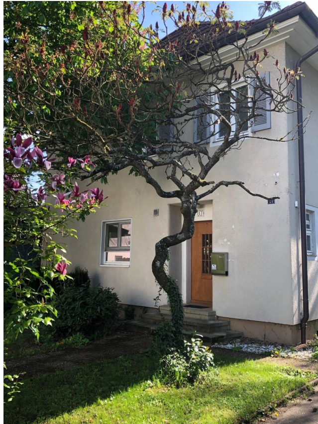
von der Strasse