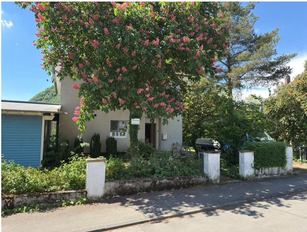
Ansicht von der Strasse