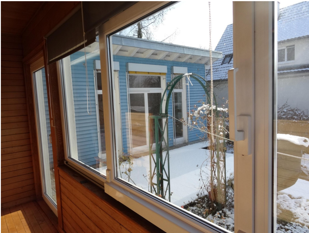
Anbau v. Wintergarten aus