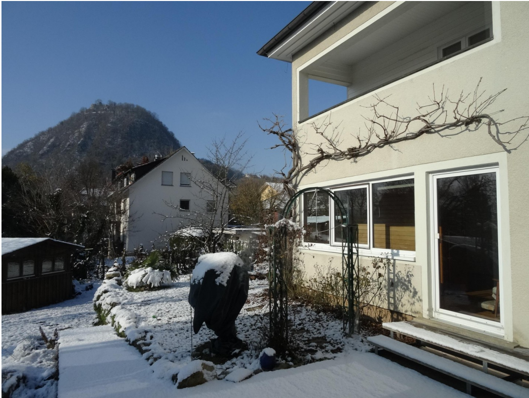
Blick von S-O auf Hohentwiel