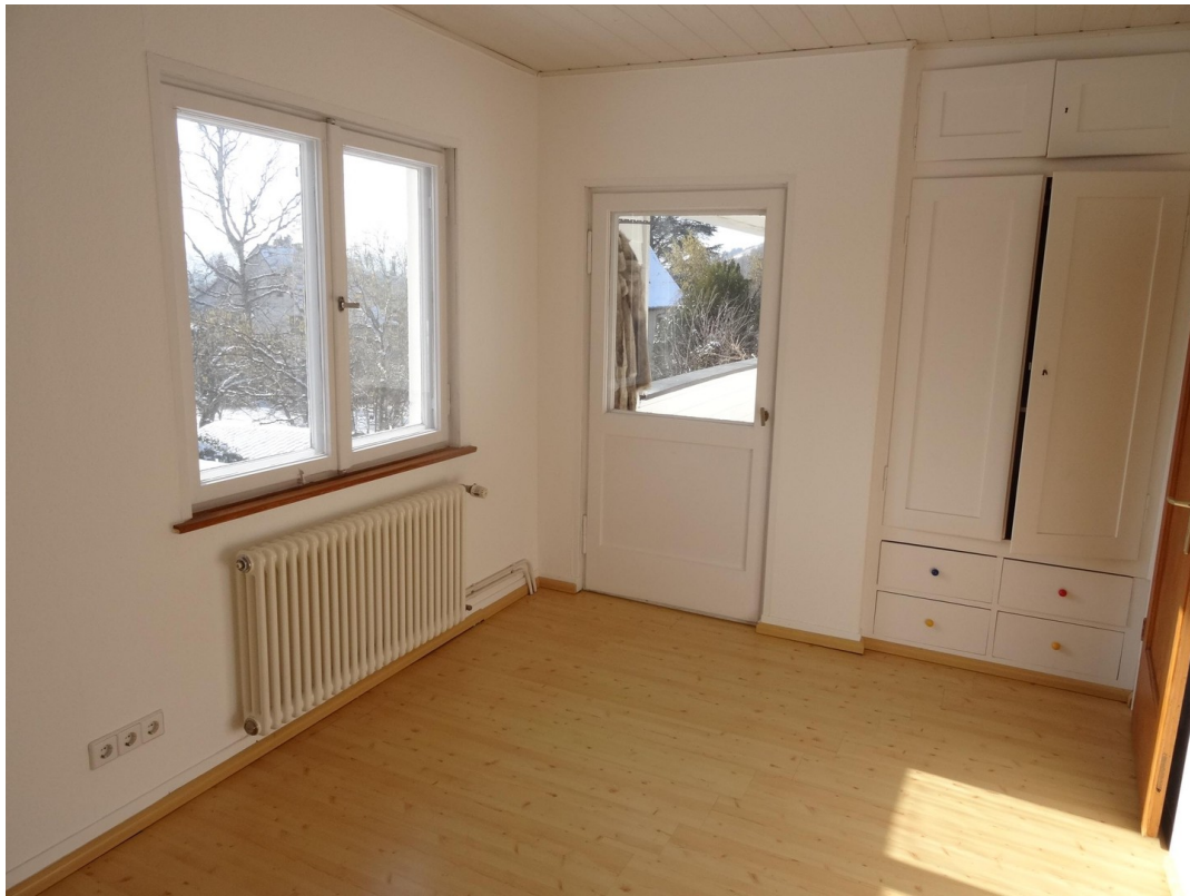
Zimmer 3 OG