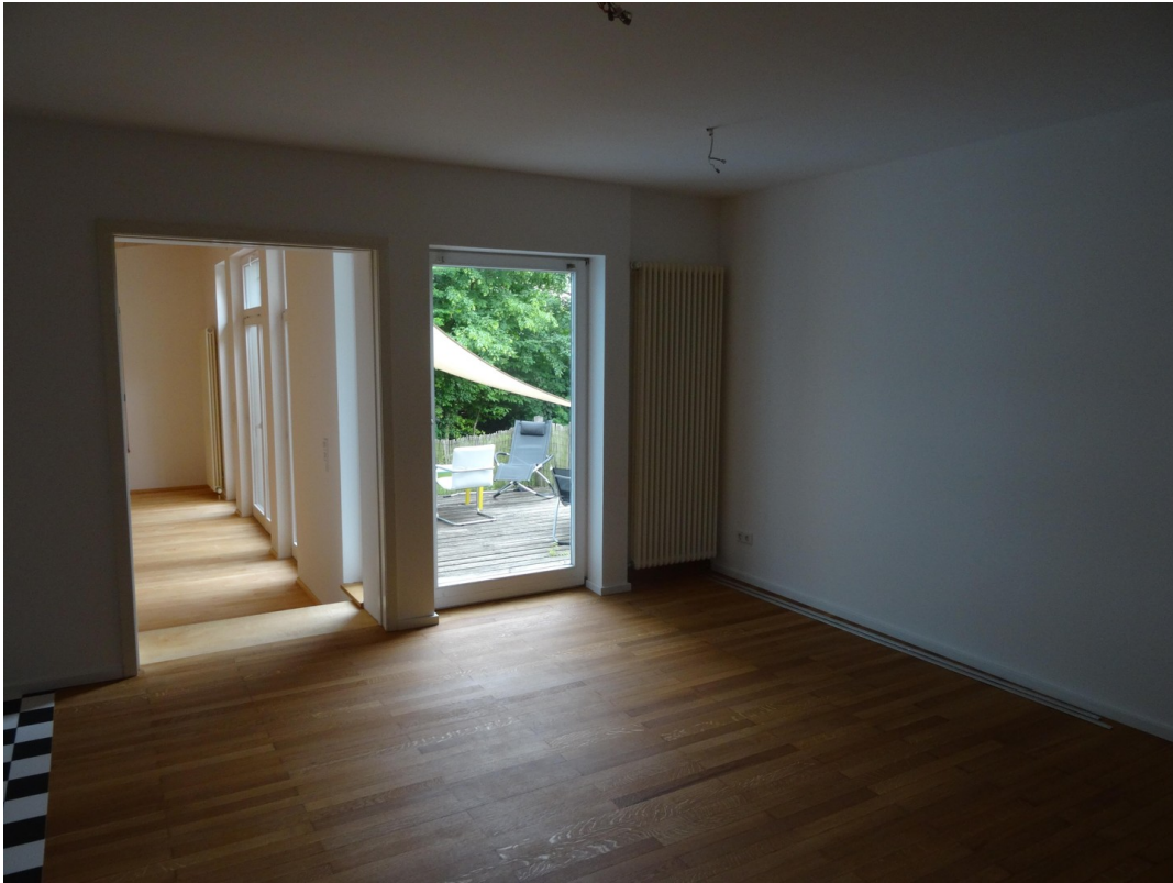
Küche Platz für Esstisch