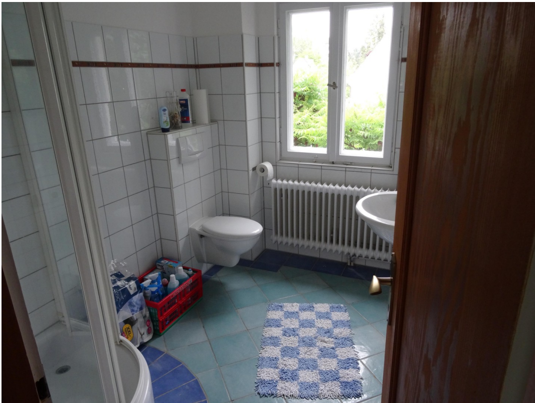
Bad OG vor Renovierung 26