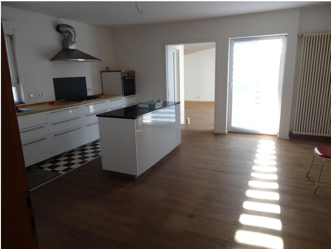
Küche n. Süd.