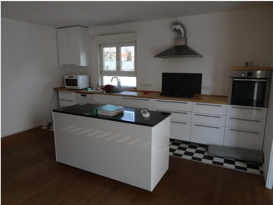
Küche n. Ost