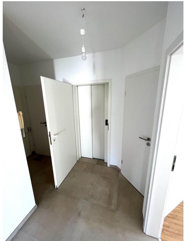
Aufzug in Wohnung