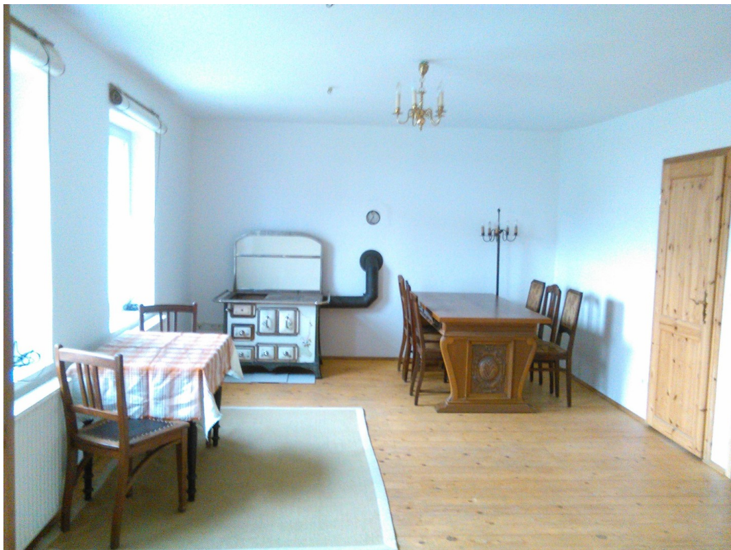
Wohnung 4 Wohnzimmer