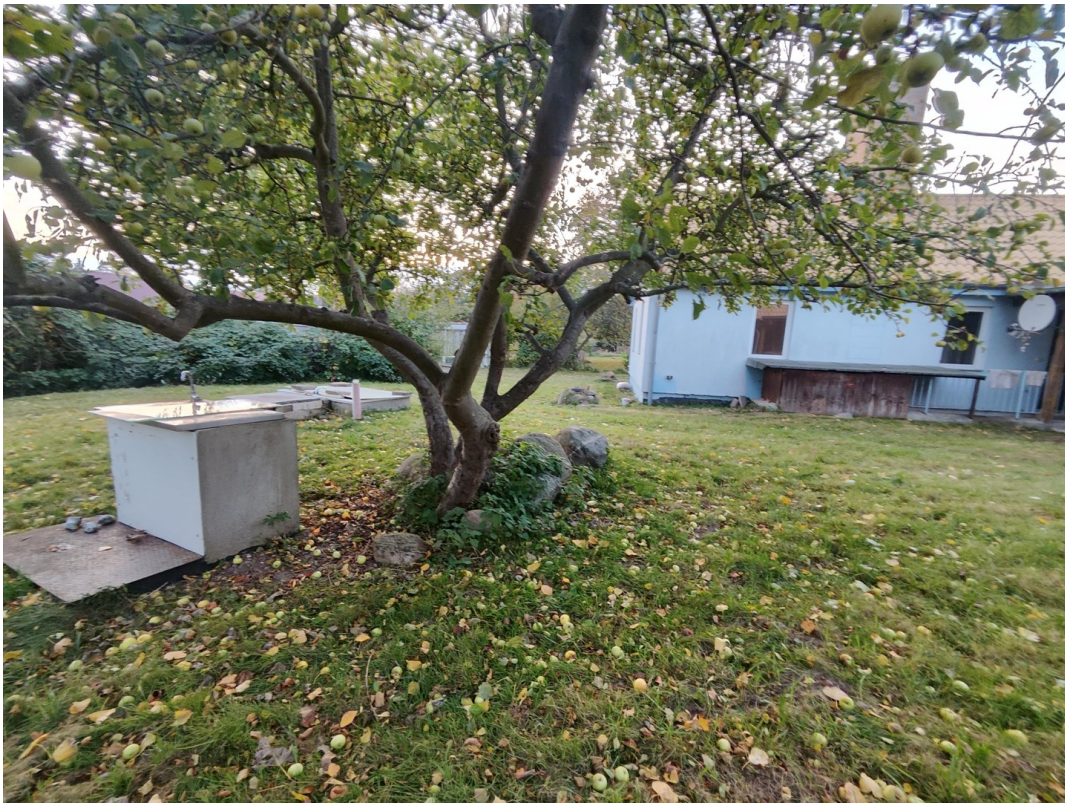
Garten mit Waschtisch