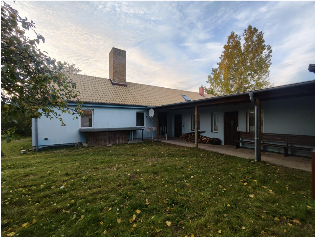
Innenhof mit Laubengang