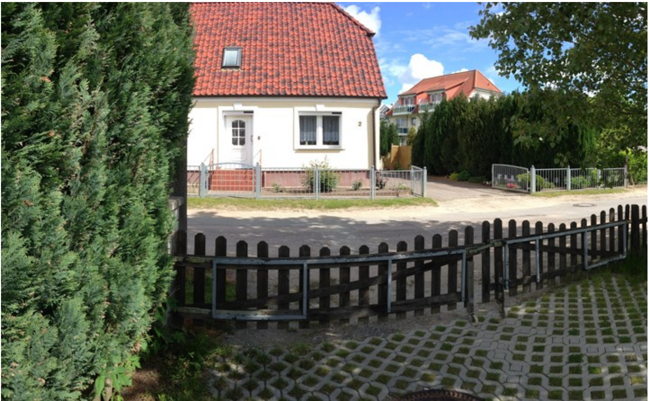
Vorderansicht mit Einfahrt