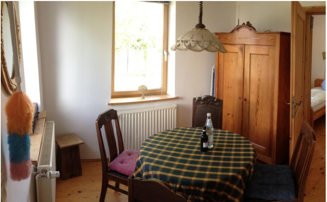
Wohnung 5 Küchenzeile