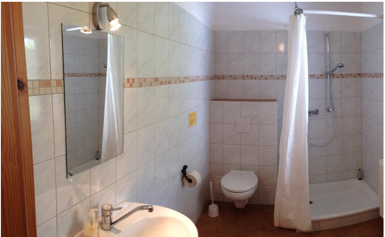
Wohnung 5 Bad 1