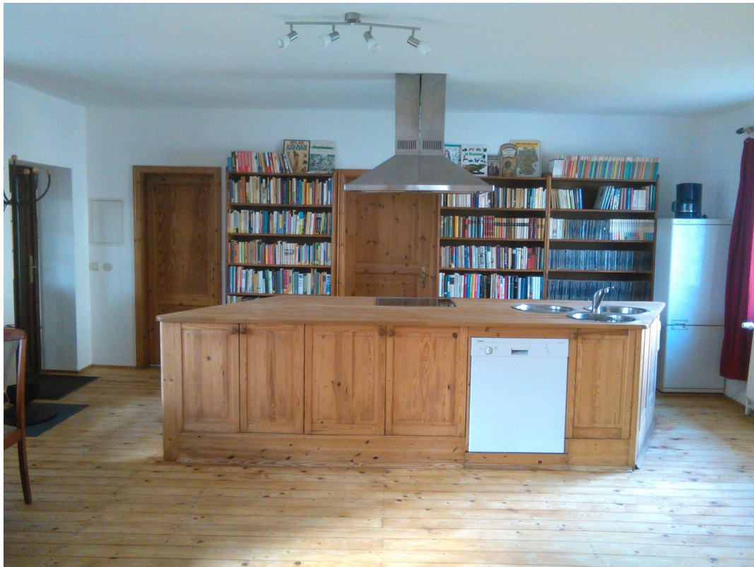
Wohnung 1 mit Küchentresen