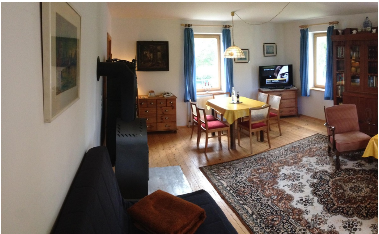
Wohnung 2 Wohnzimmer