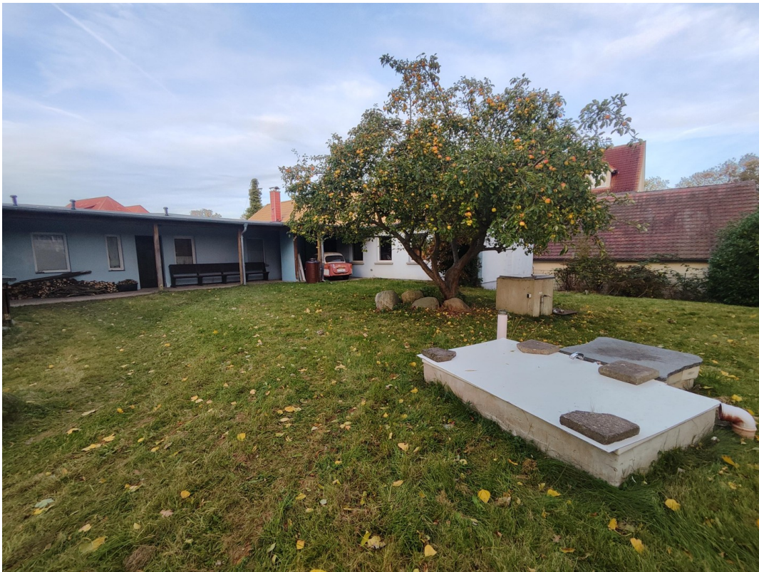
Garten mit Poolwanne