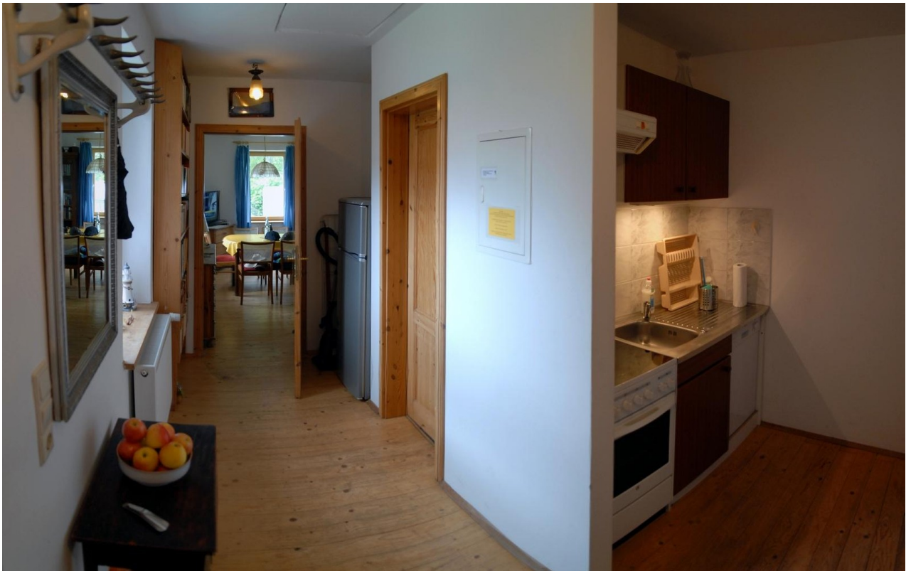
Wohnung 2 Flur mit Küche