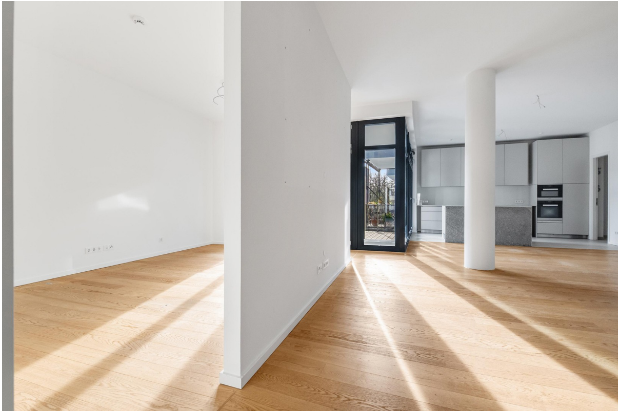
Wohnraum mit Küche 2