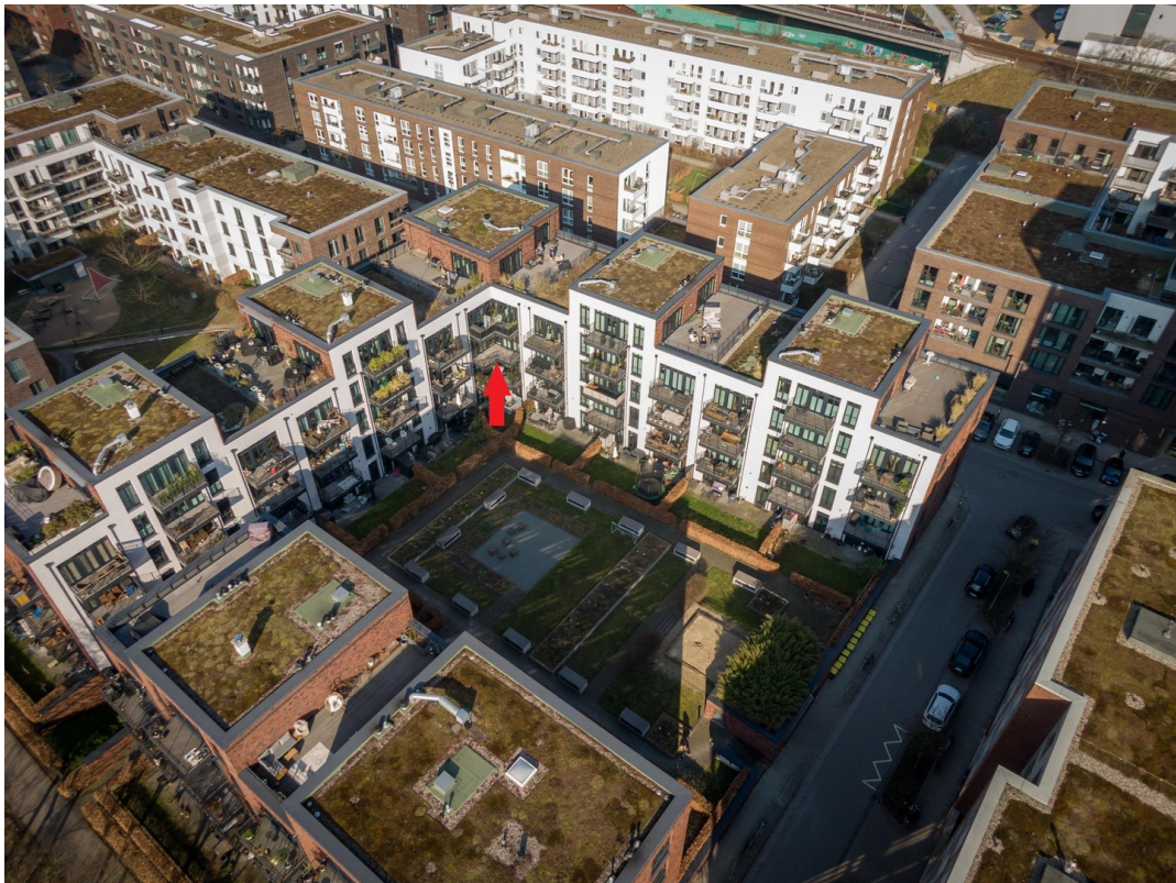
Luftbild mit Markierung