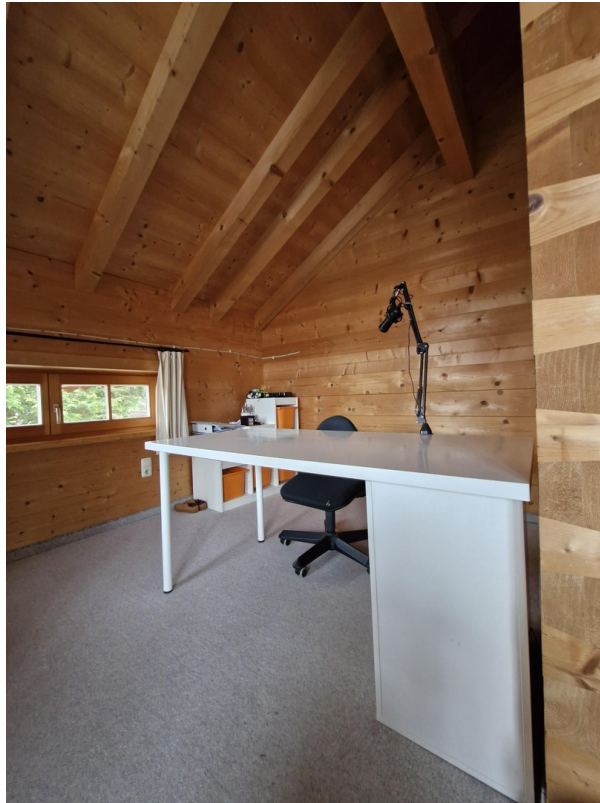
Schlafzimmer 2 OG