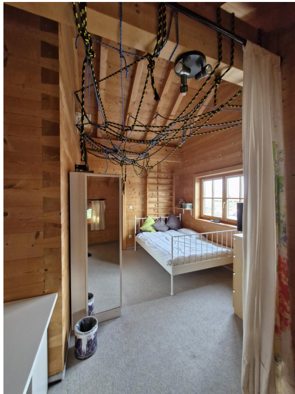
Schlafzimmer 2 OG