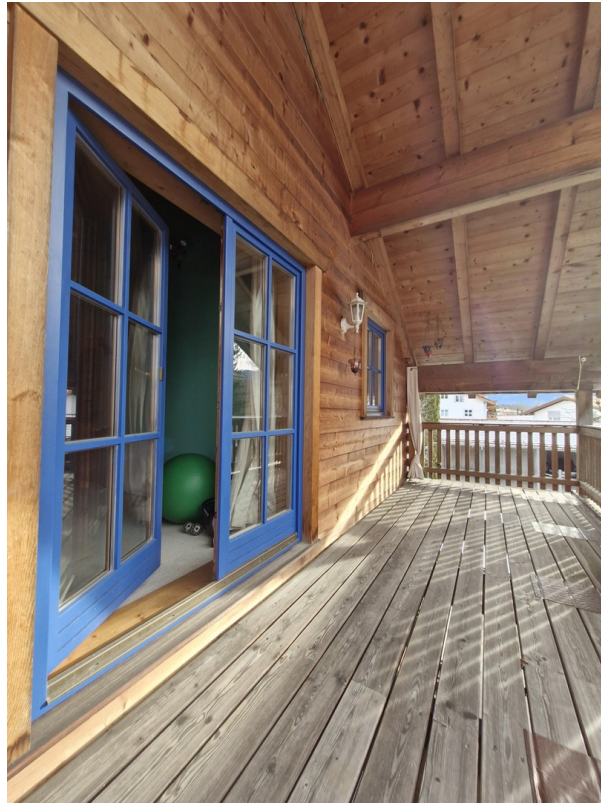
Balkon OG Fitnessraum