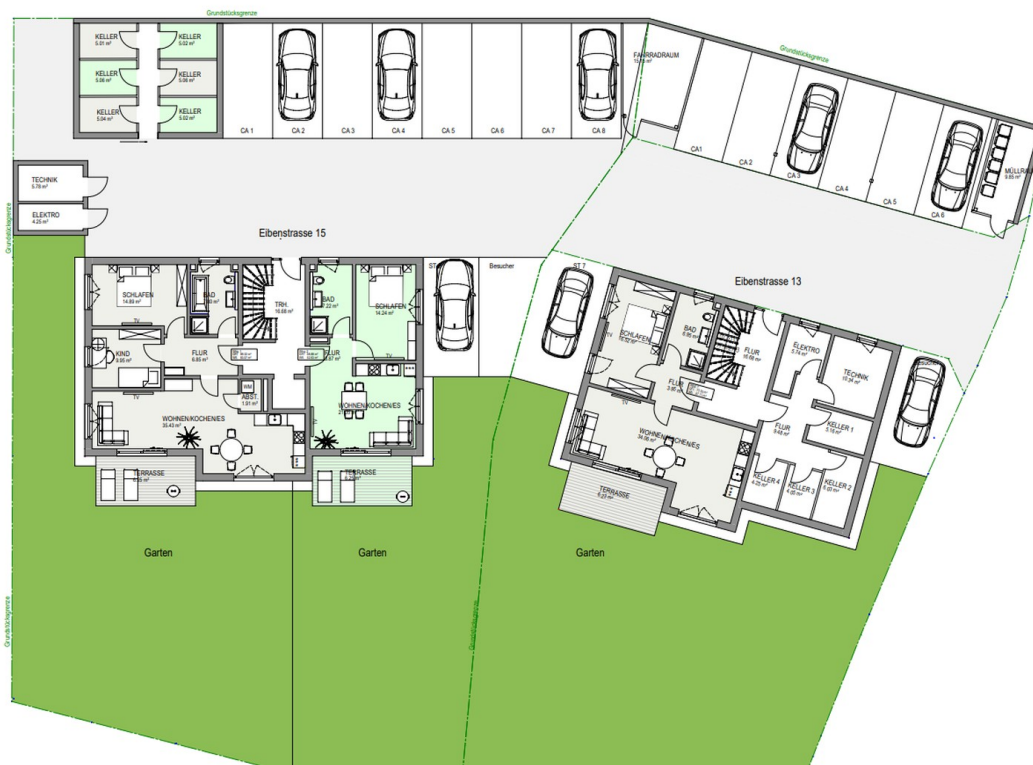
Grundriss Haus 1 + Haus 2