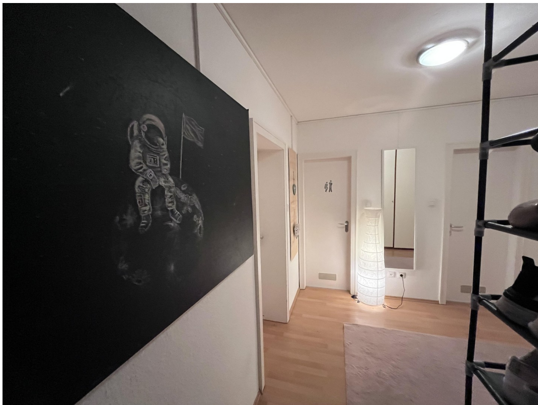
Flur vom Eingang aus