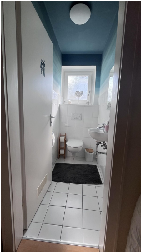
Getrenntes WC 1