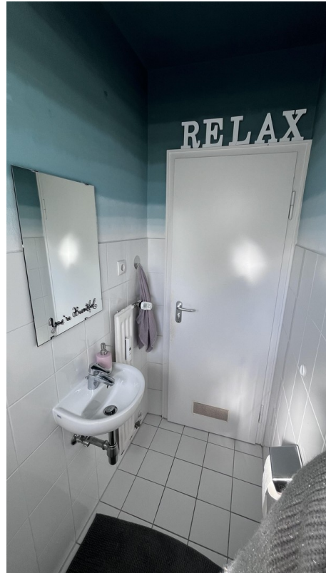
Getrenntes WC 2