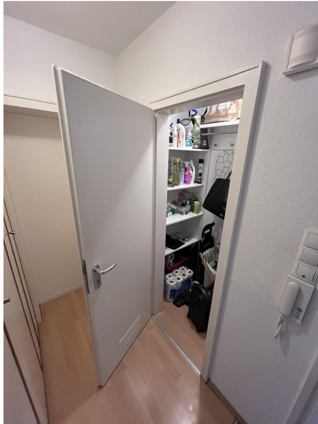
Abstellkammer neben Eingang