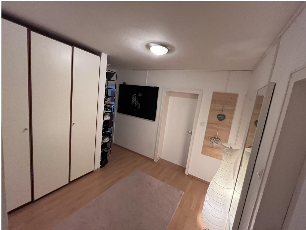
Flur mit Einbauschränk links