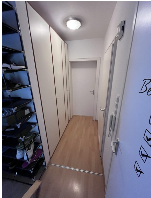
Flur mit Einbauschränk rechts