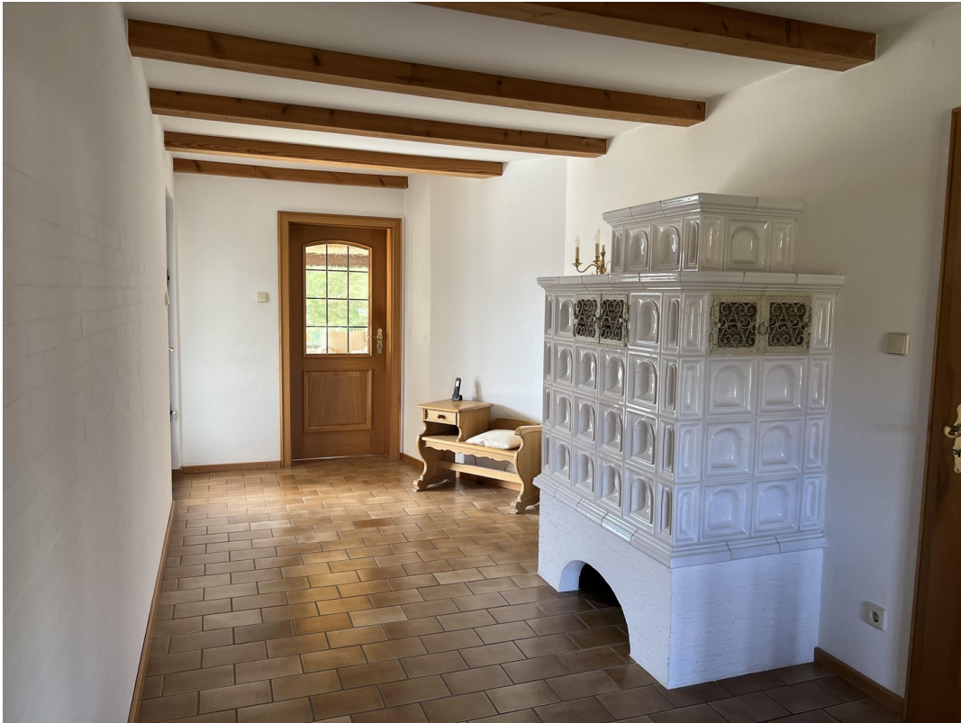
Diele mit Kachelofen