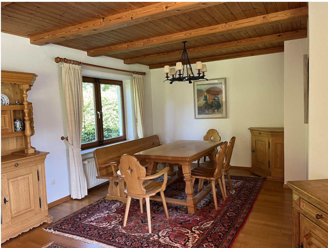
Essecke im Wohnzimmer