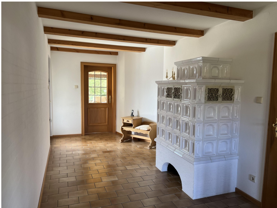
Diele mit Kachelofen