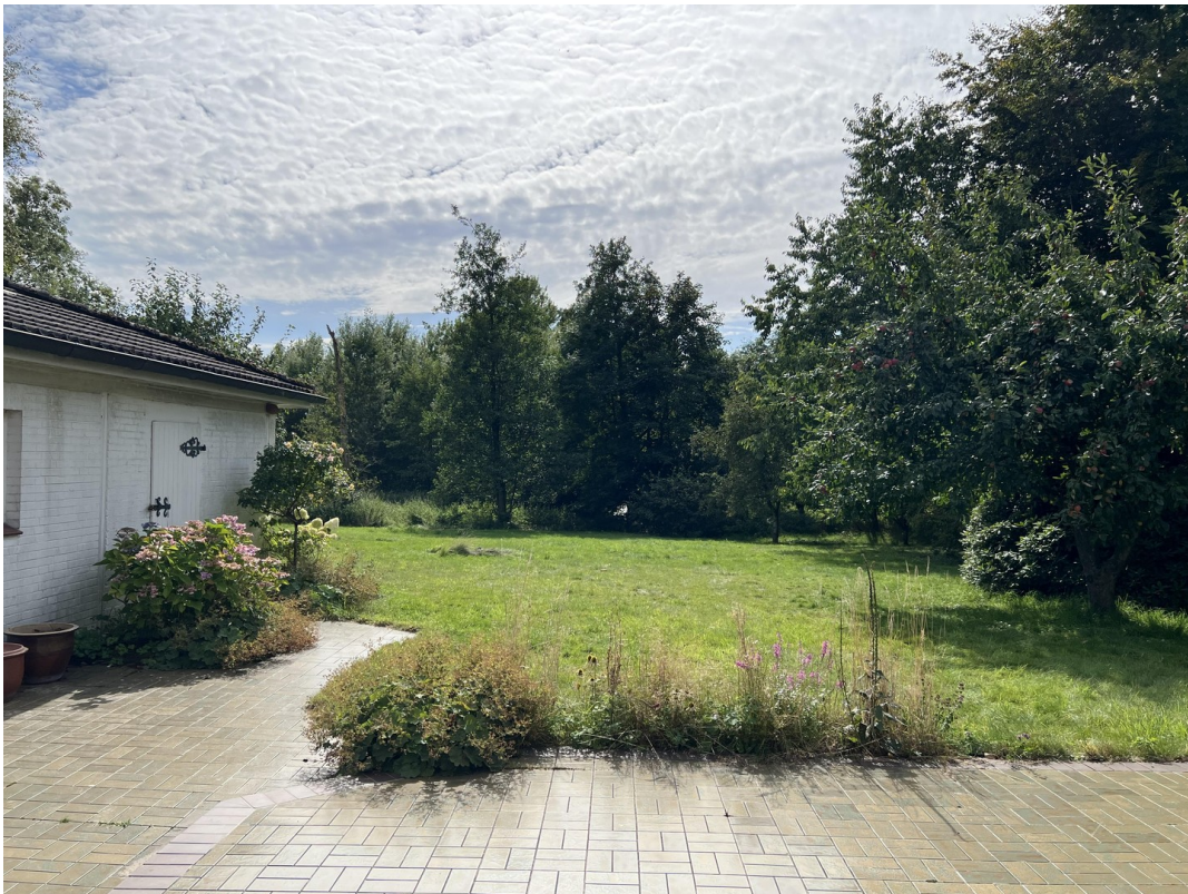
Terrasse mit Gartenblick