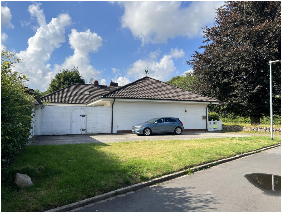
Ostseite des Hauses