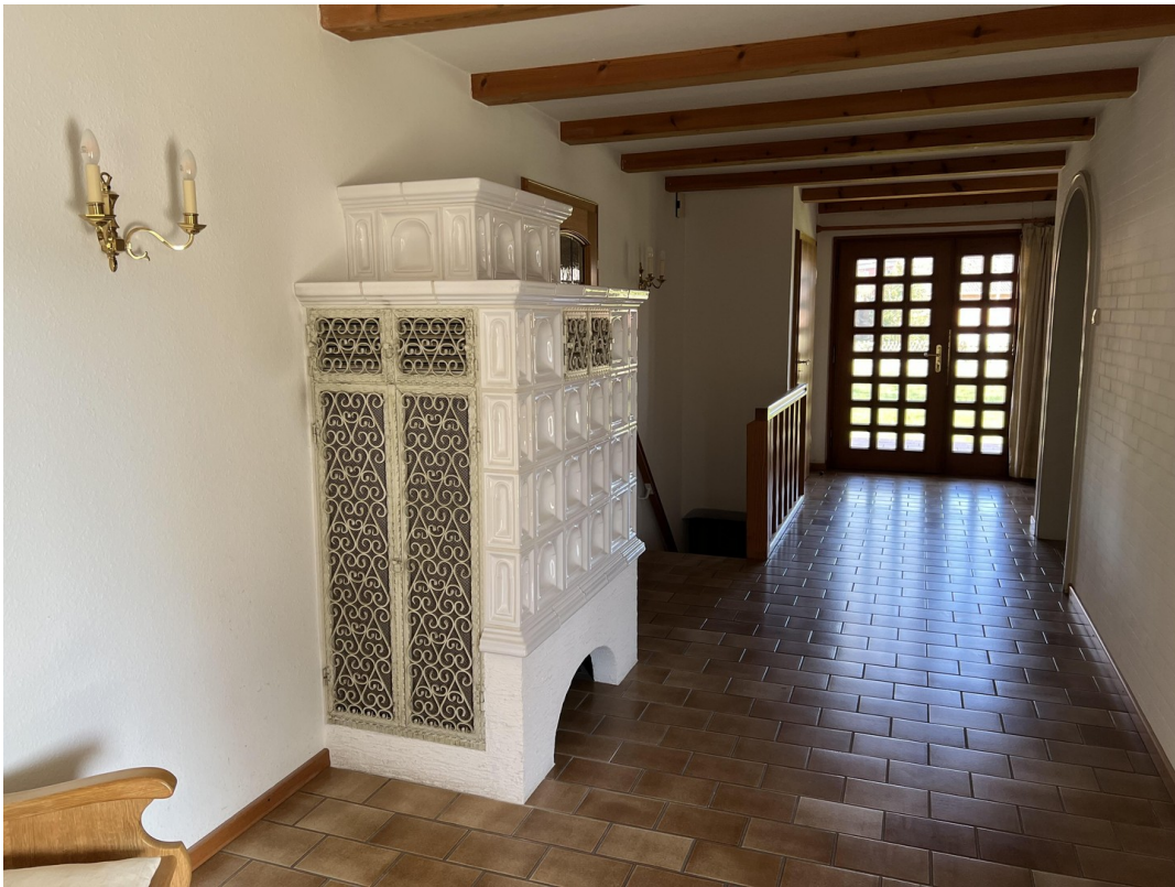
Diele mit Kachelofen