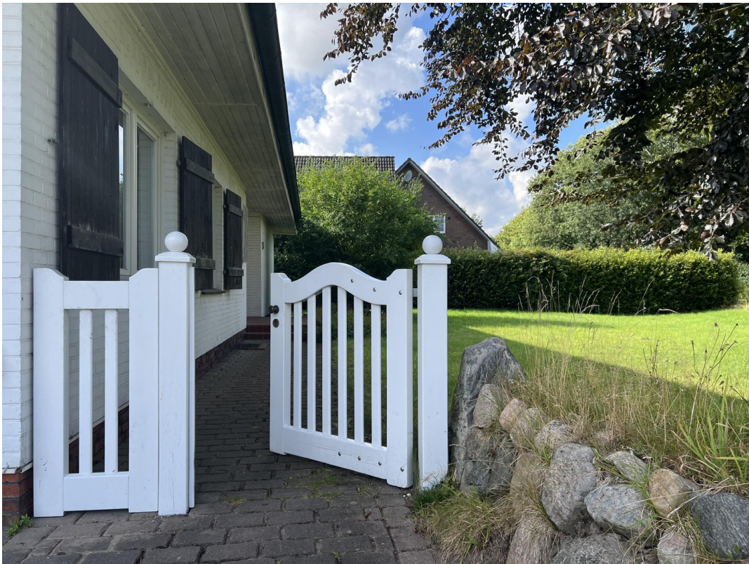
Weg zum Eingang