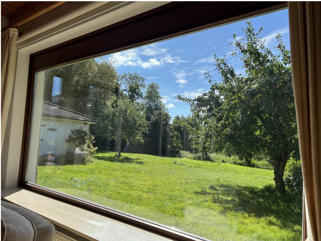
Panoramafenster im Wohnzimmer