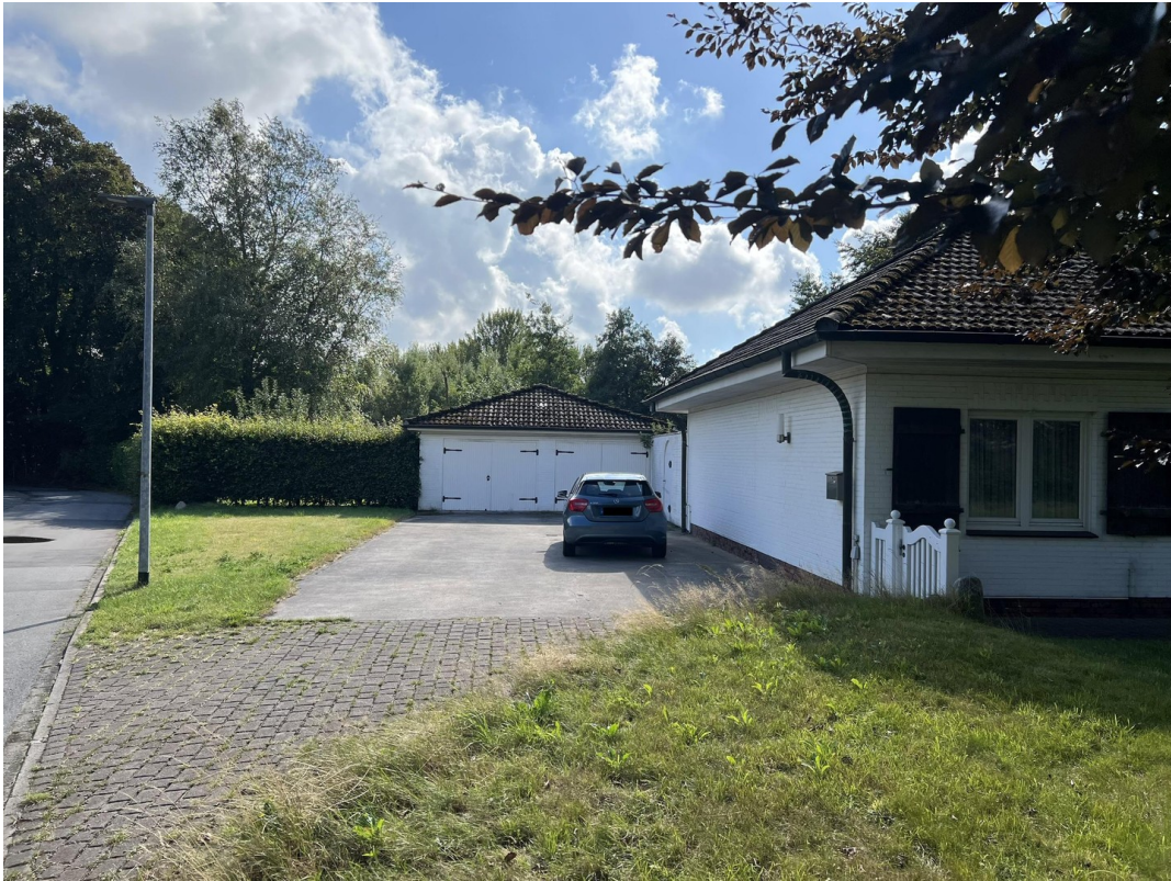
Einfahrt zur Garage