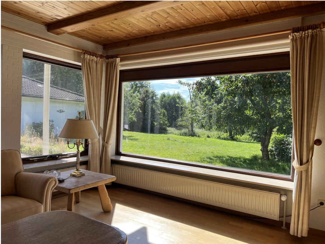
Ausblick in den Garten