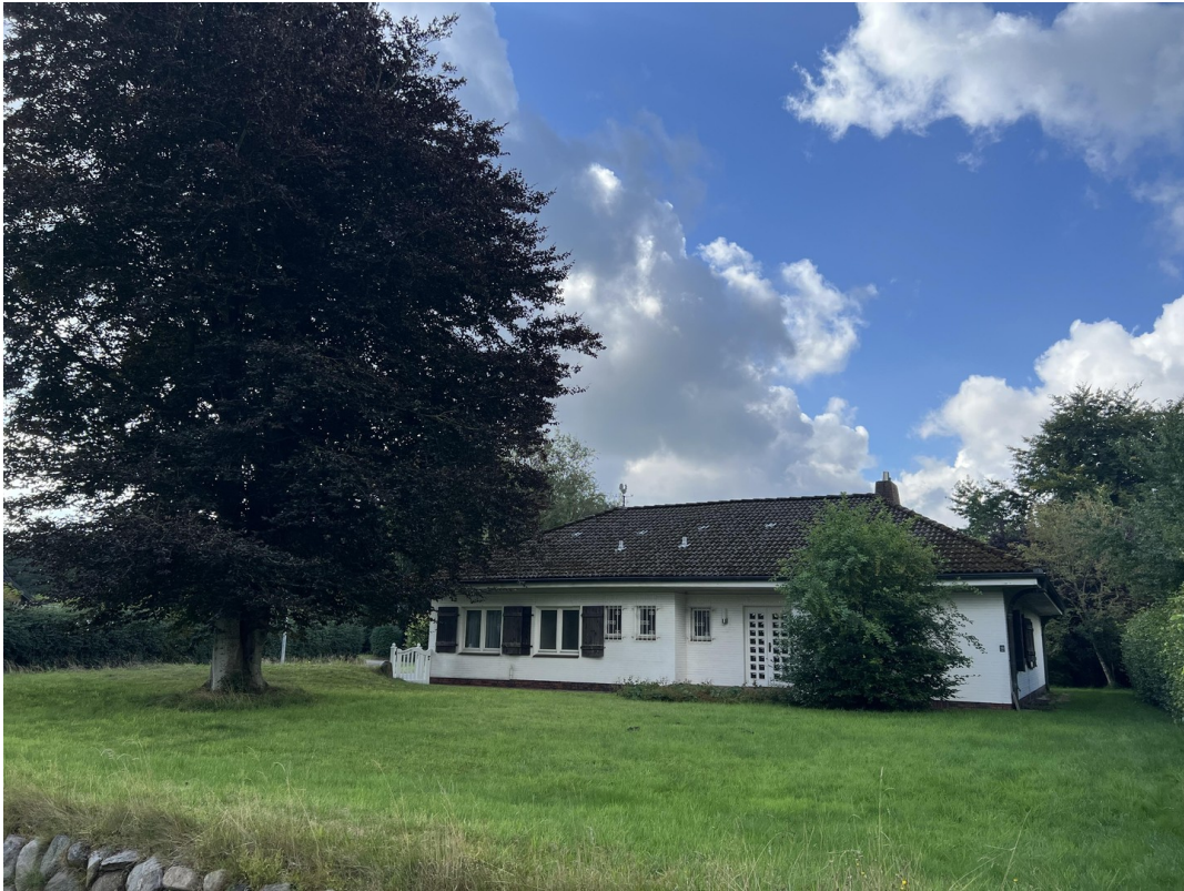
Nordseite des Hauses