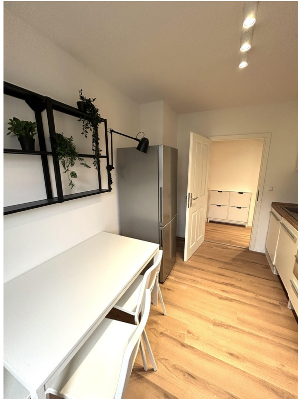
Kitchen rear view