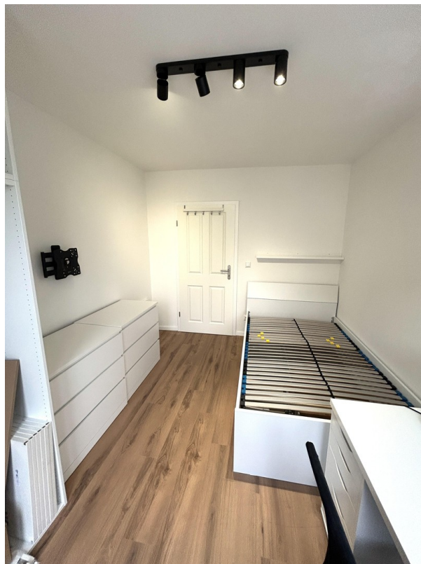
Room 2 rear view