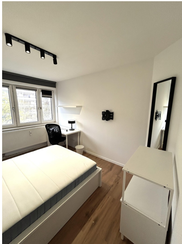
Room 3 side view