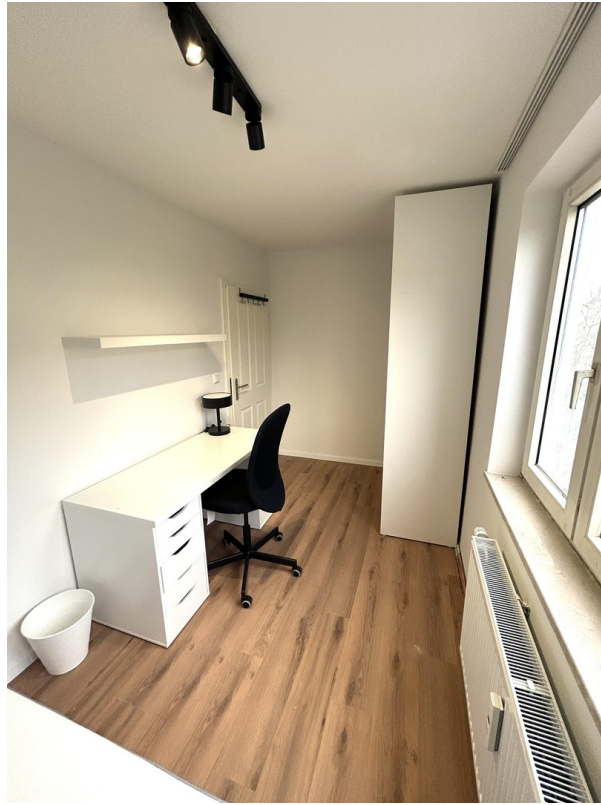
Room 1 rear view