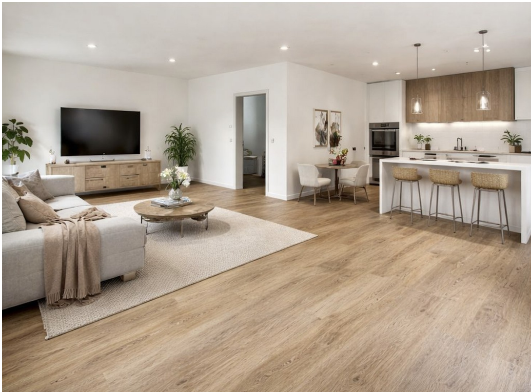
Wohnzimmer mit KI gearbeitet