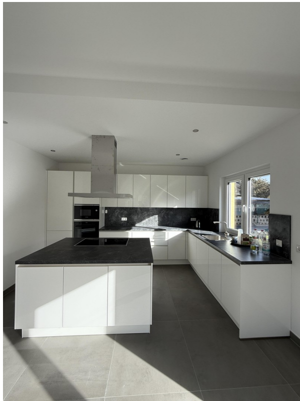
Küche als Referenz Objekt 2025