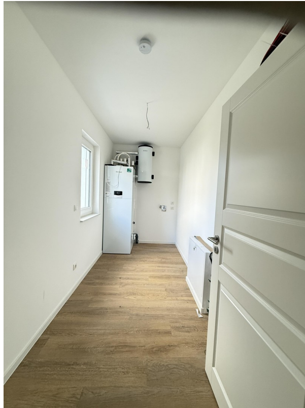
Anschluss- und Waschsraum