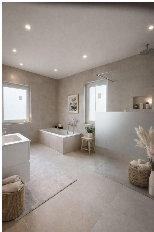
Bad mit KI fertig gestellt