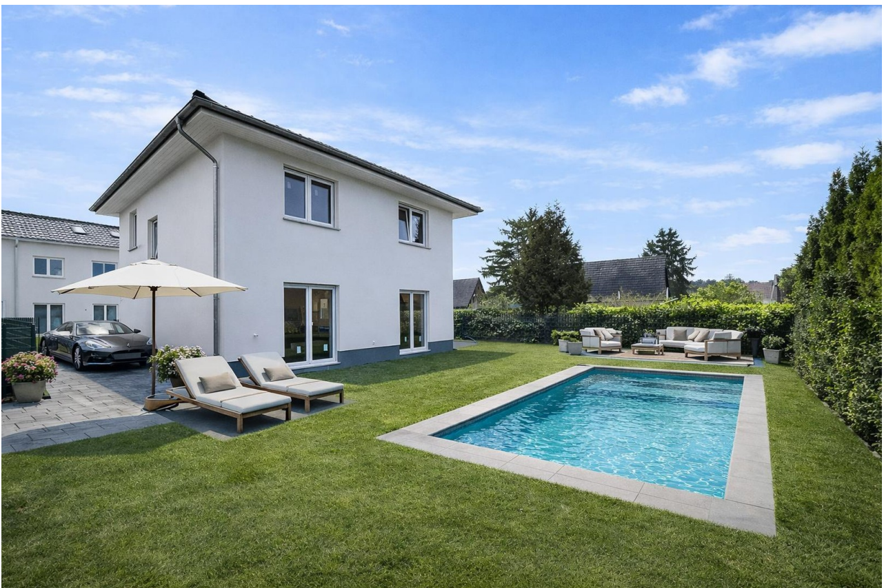
Ansicht Beispiel mit Pool (KI)