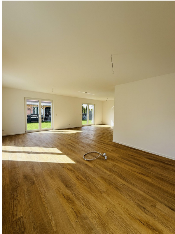
Küche + Wohnen