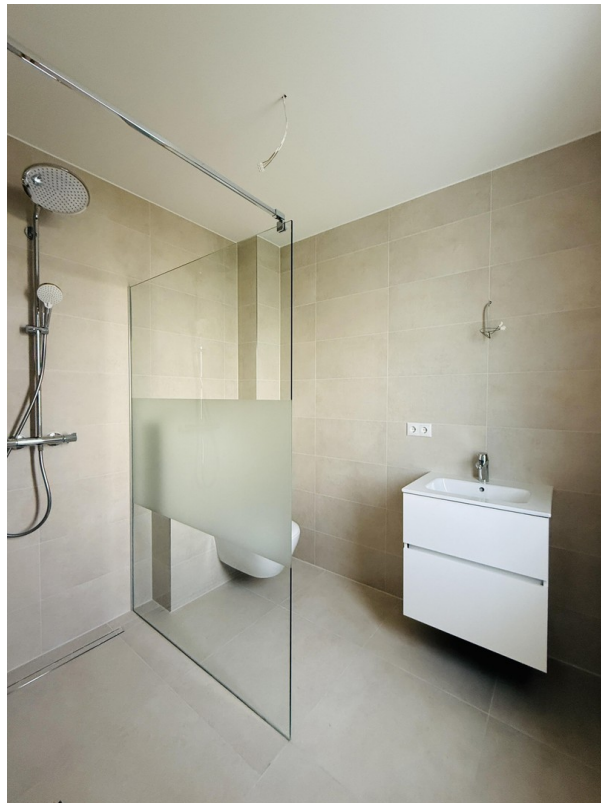
Gäste Bad + WC