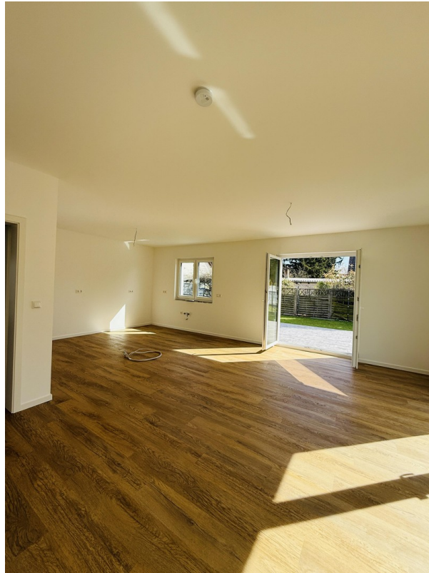
Küche + Wohnen