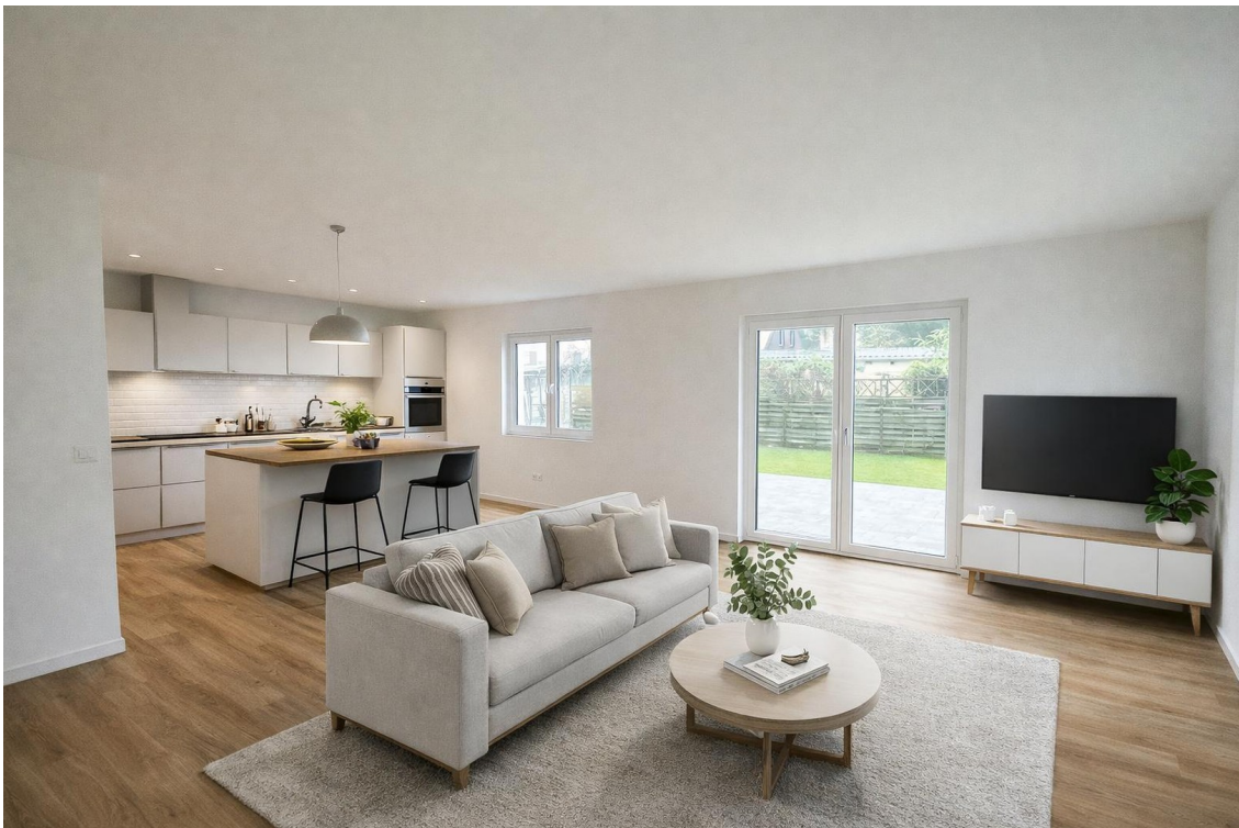
Wohnküche mit KI gearbeitet