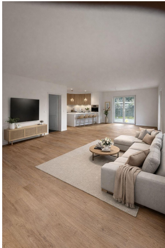
Wohnzimmer mit KI gearbeitet