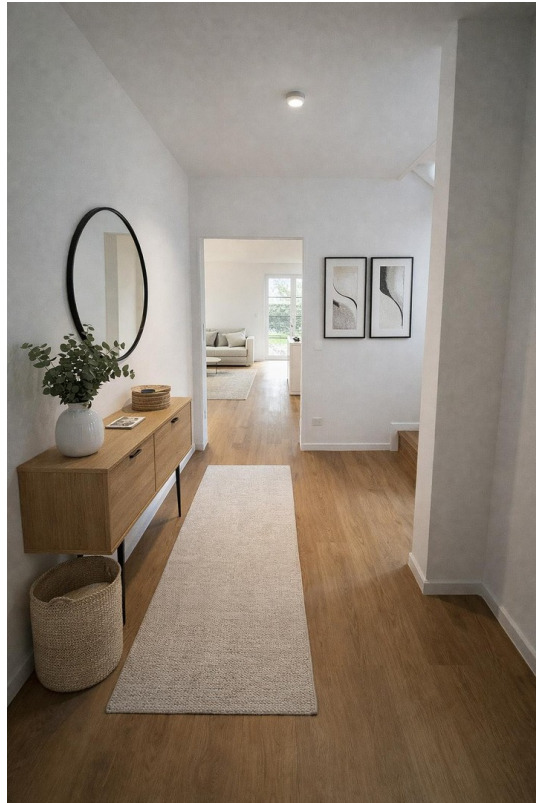
Flur Musterfoto EG