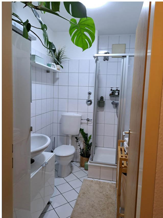
Duschbadezimmer mit WC