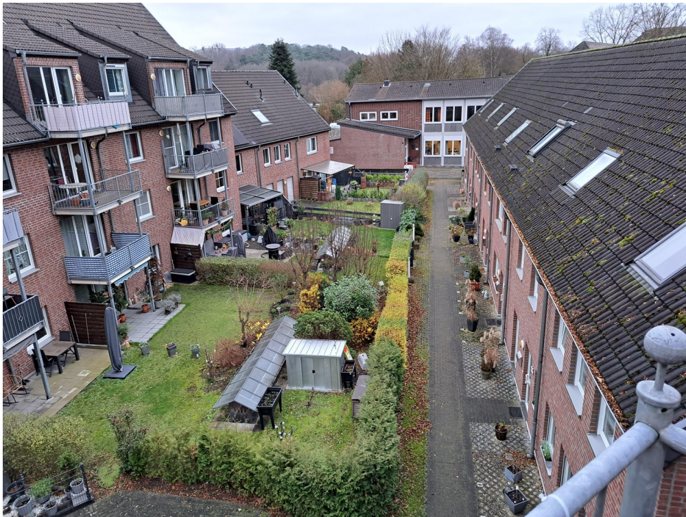
Blick auf Garten-/Hofanlage