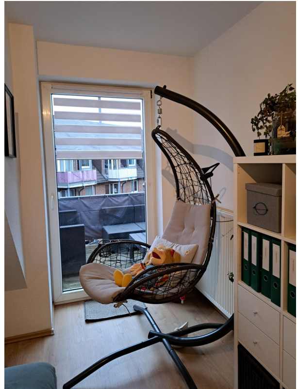
Wohnzimmertür zum Balkon