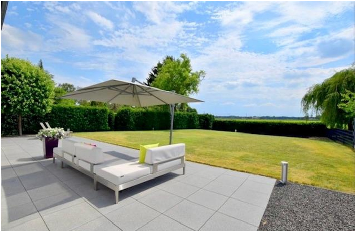
Terrasse mit Weitblick