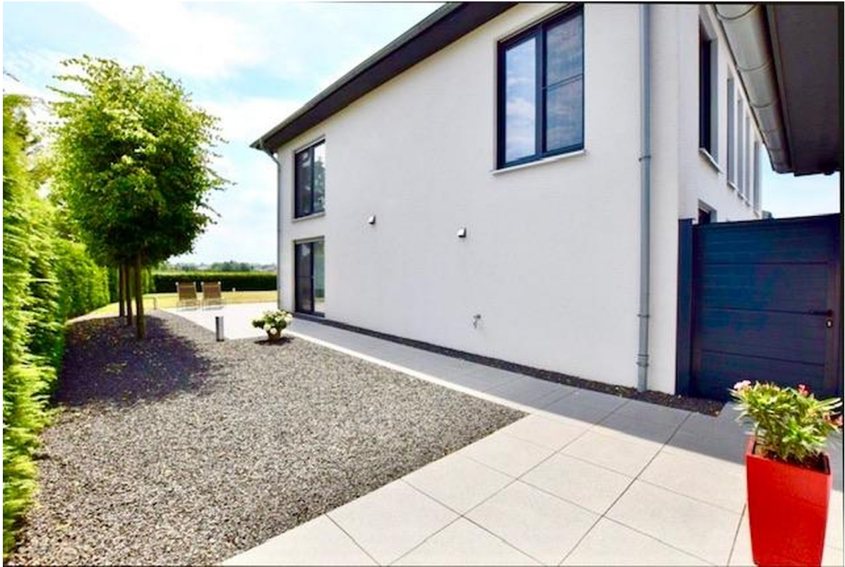
Terrasse am Garagenhaus