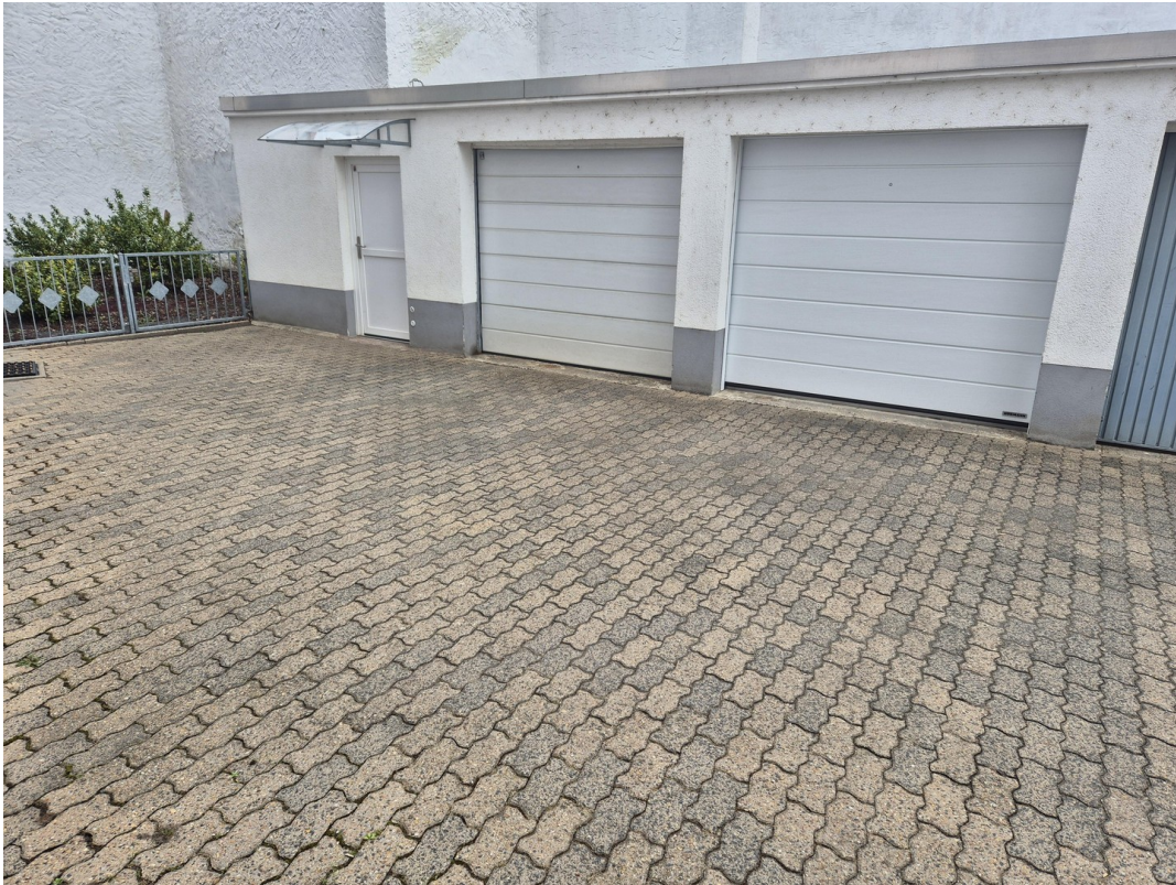
Werkstatt + Garage