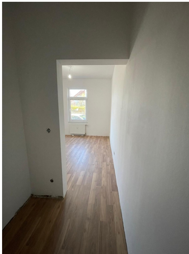
Elternschlafzimmer aus Nische