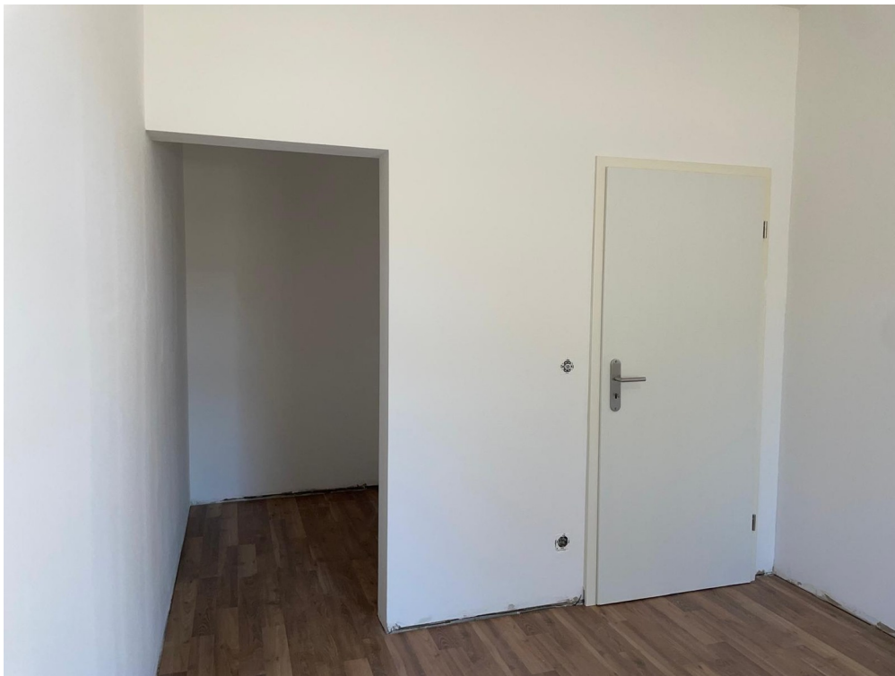
Elternschlafzimmer mit Nische