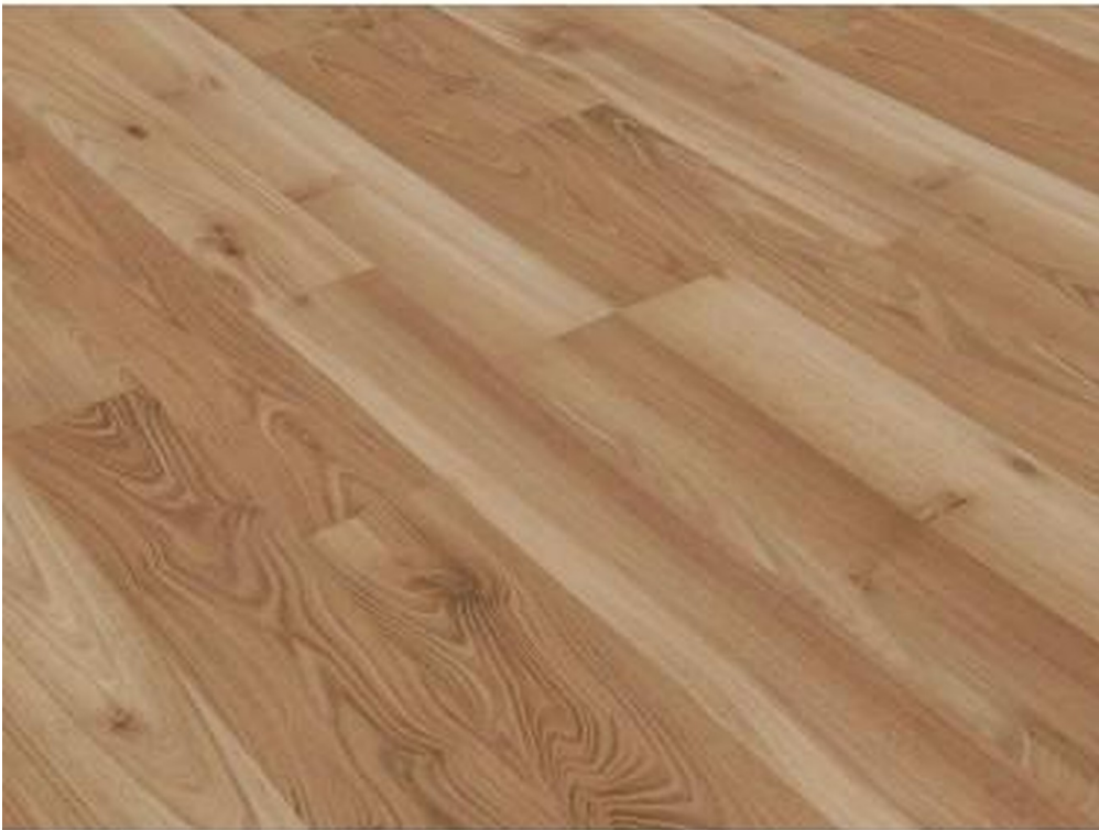
Neuer Fußboden in allen Räumen