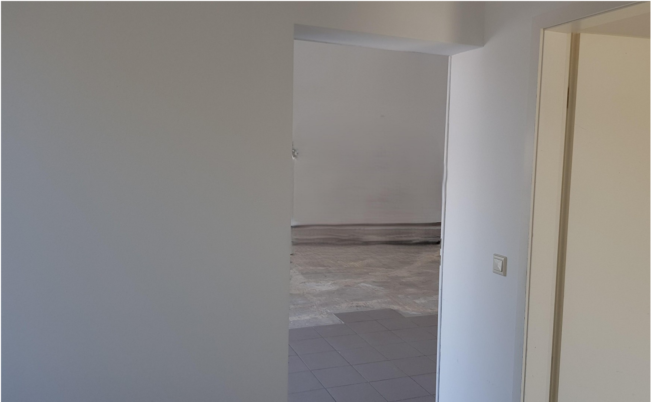
Durchgang zur Halle