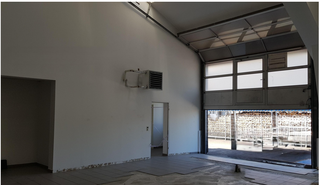
Halle mit Rolltor