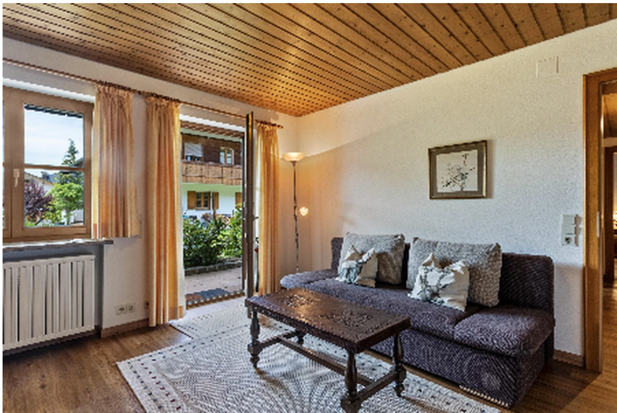
Wohnzimmer mit Gartenzugang