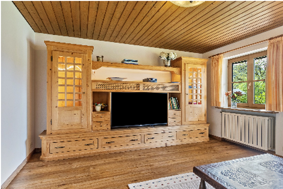
Wohnzimmer mit Zugang zum Gart