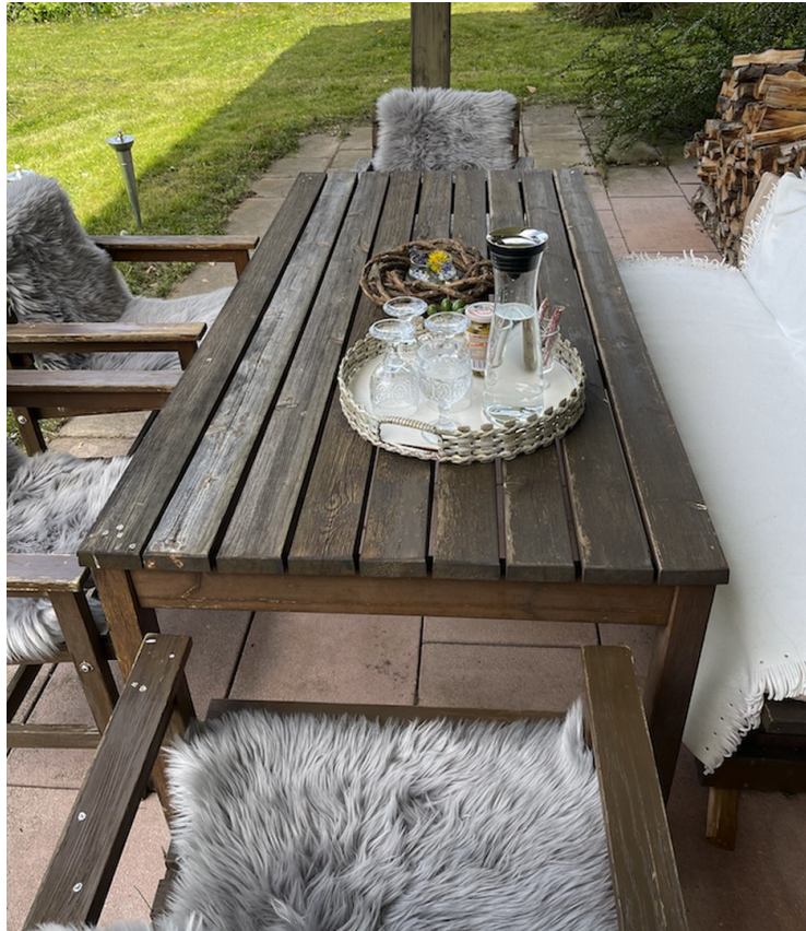
Brotzeit auf der Terasse