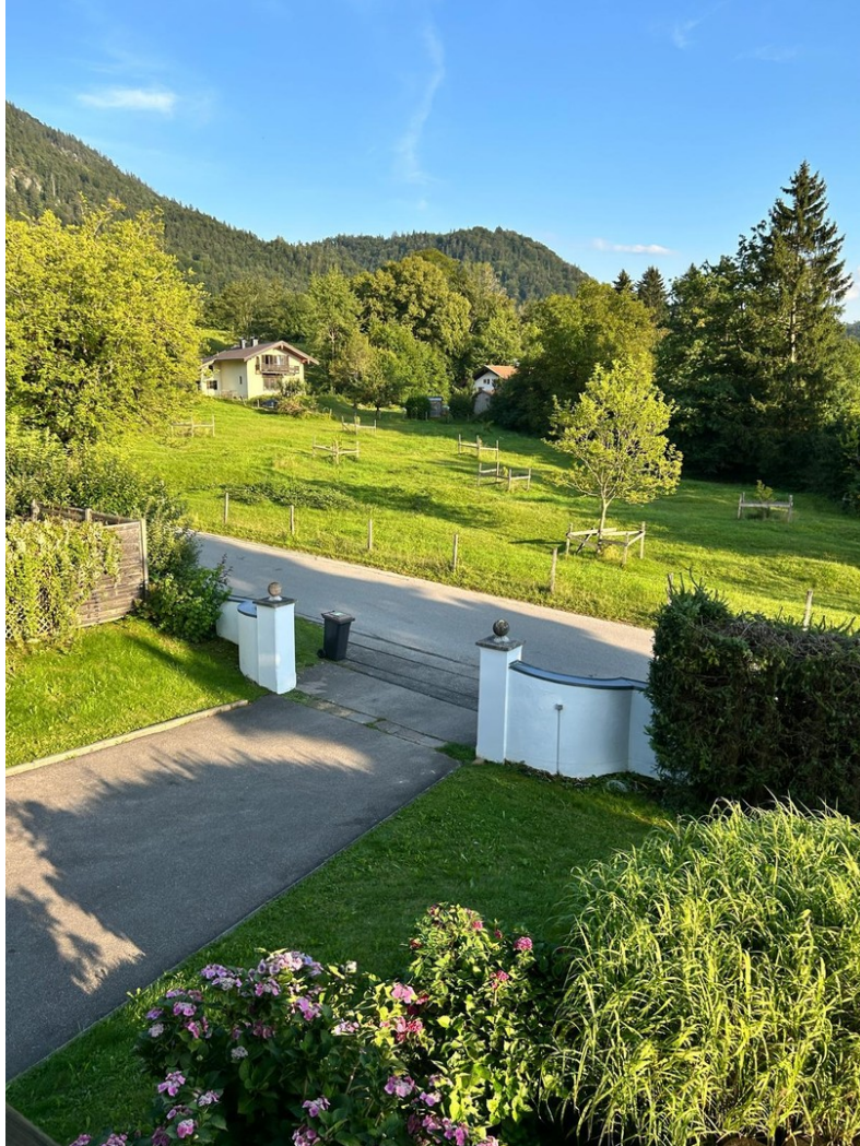
Naturschutzgebiet vor dem Haus