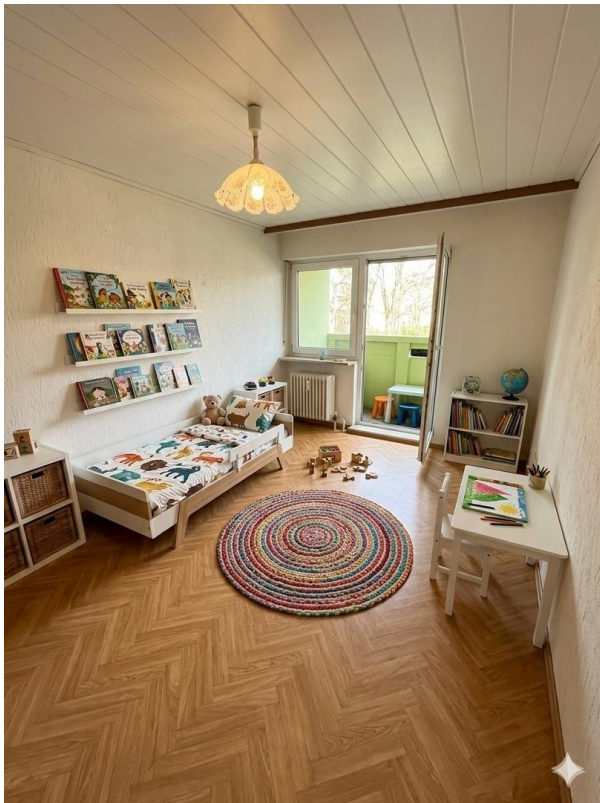
Beispiel Schlafzimmer 2