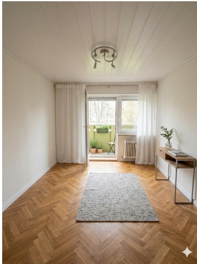
Beispiel Schlafzimmer 1