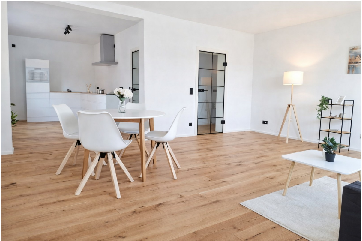
Wohn- Essbereich II