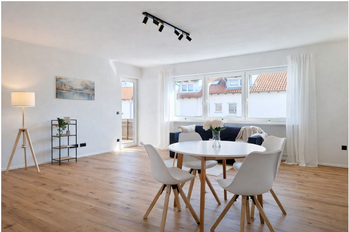
Wohn- Essbereich II