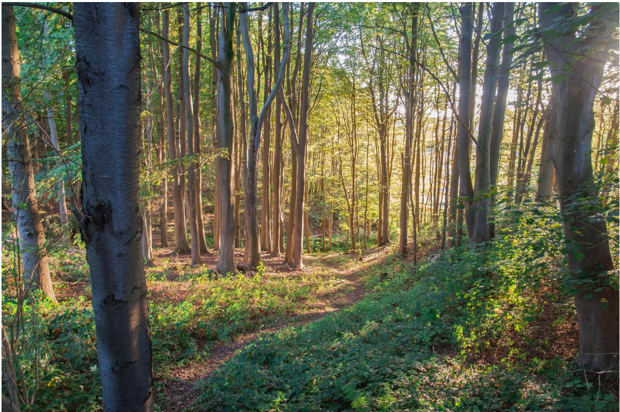
Durch den eigenen Wald