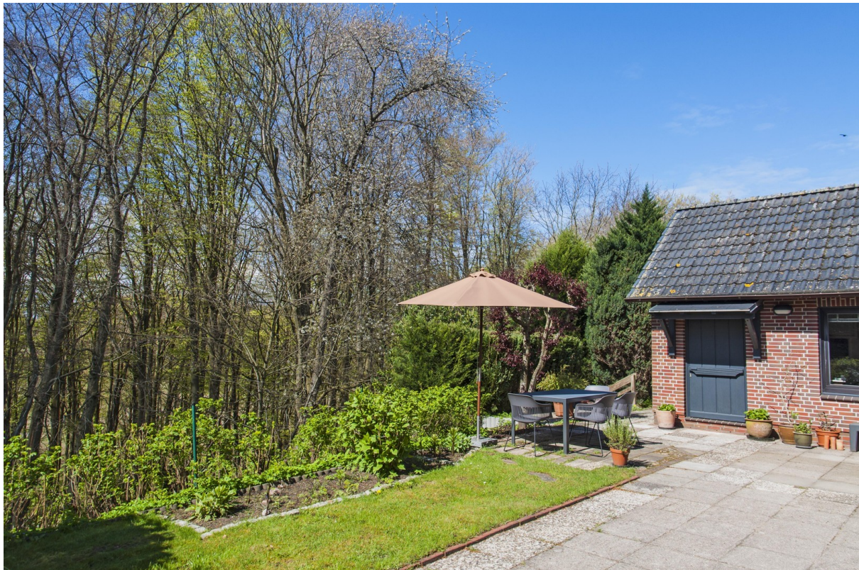
Terrasse und Garage