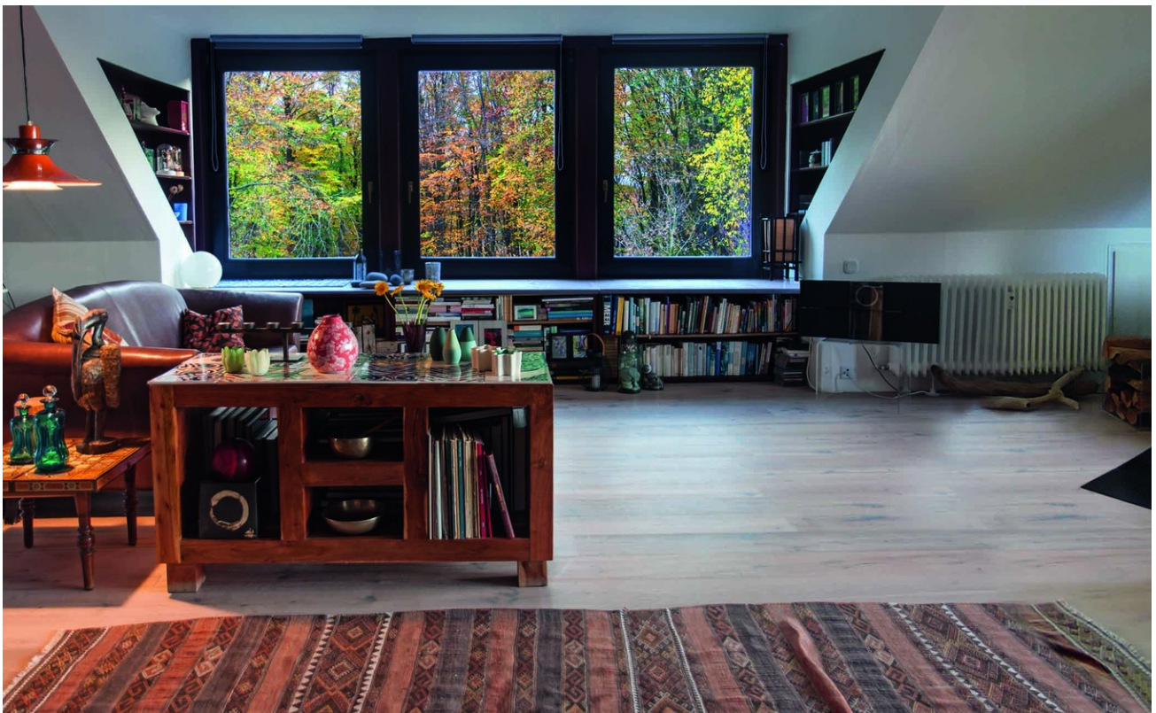
Loft im Obergeschoss