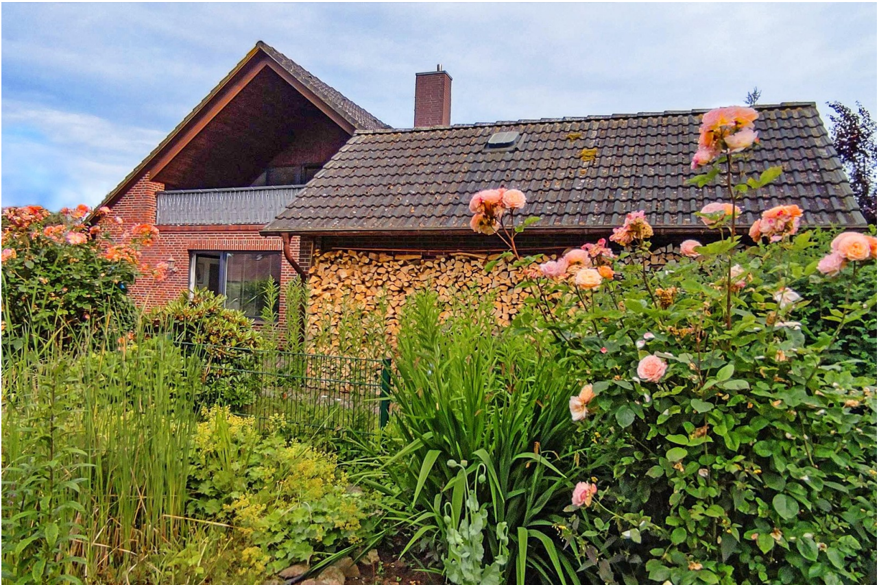
Seitenansicht mit Garage