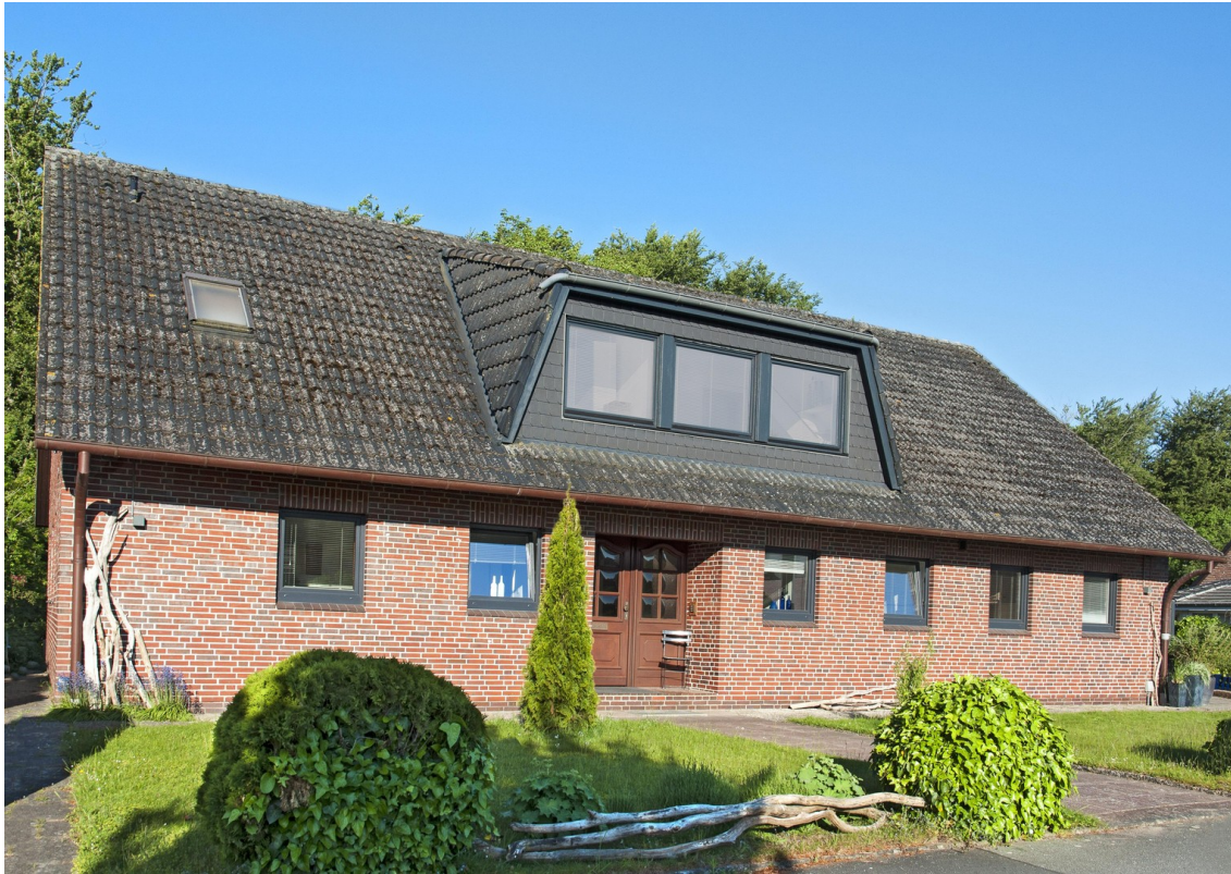
Haus mit Vorgarten