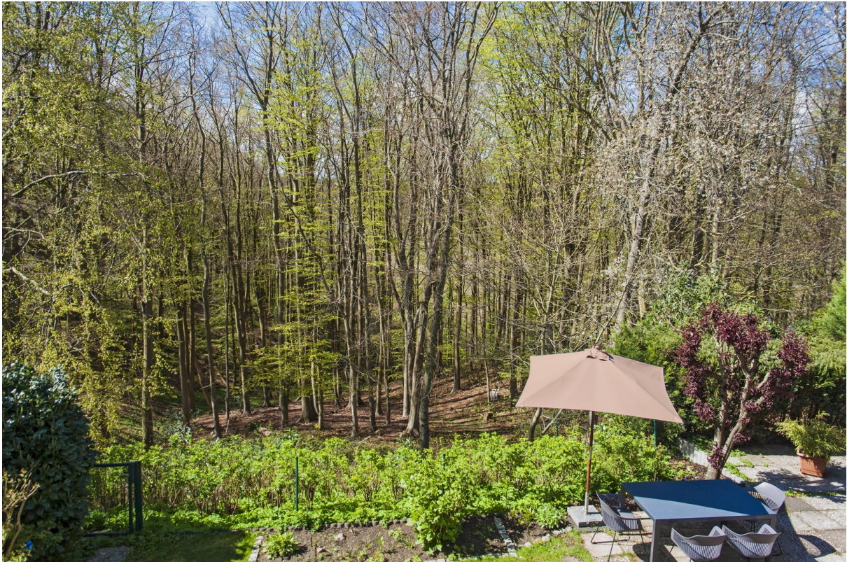
Terrasse mit eigenem Wald