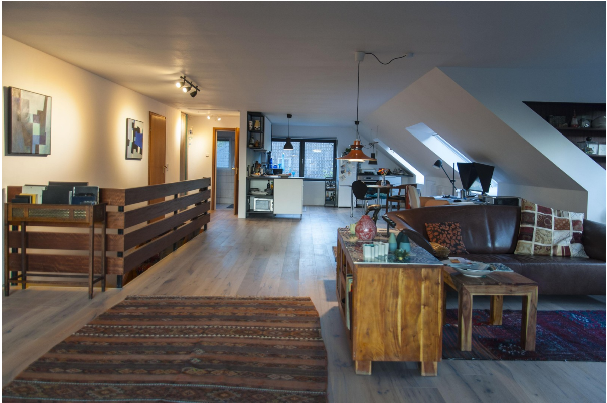
Loft im Obergeschoss