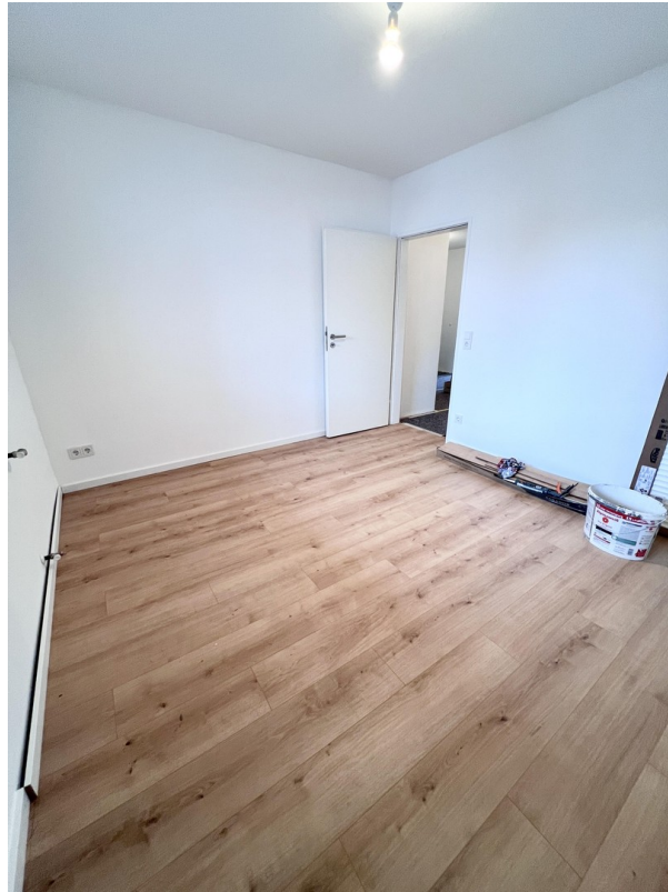
SZ/ KiZ/ Büro 2