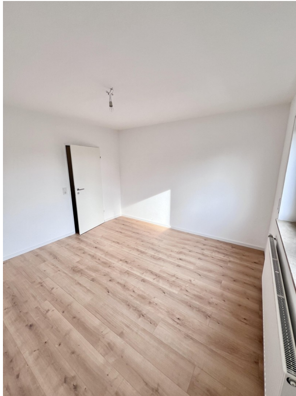
SZ/ KiZ/ Büro 1