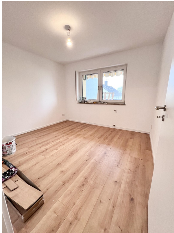
SZ/ KiZ/ Büro 2