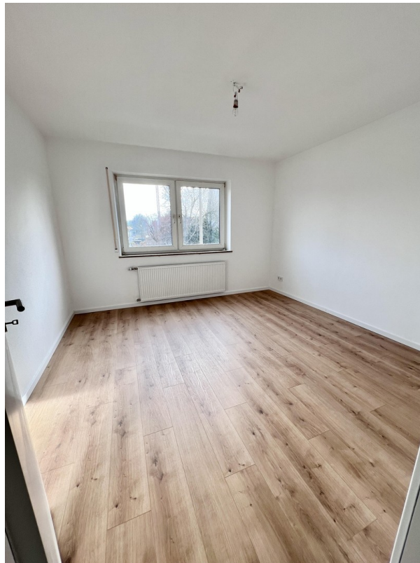
SZ/ KiZ/ Büro 1