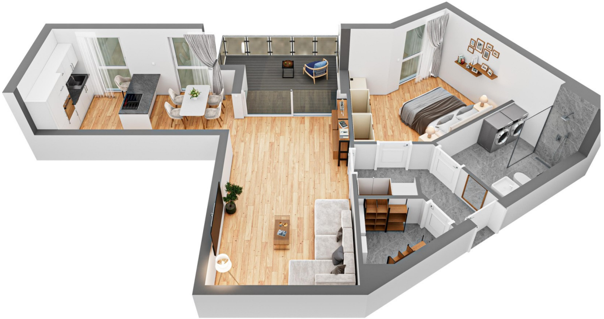
Grundriss 2 Zimmer Große Whn.