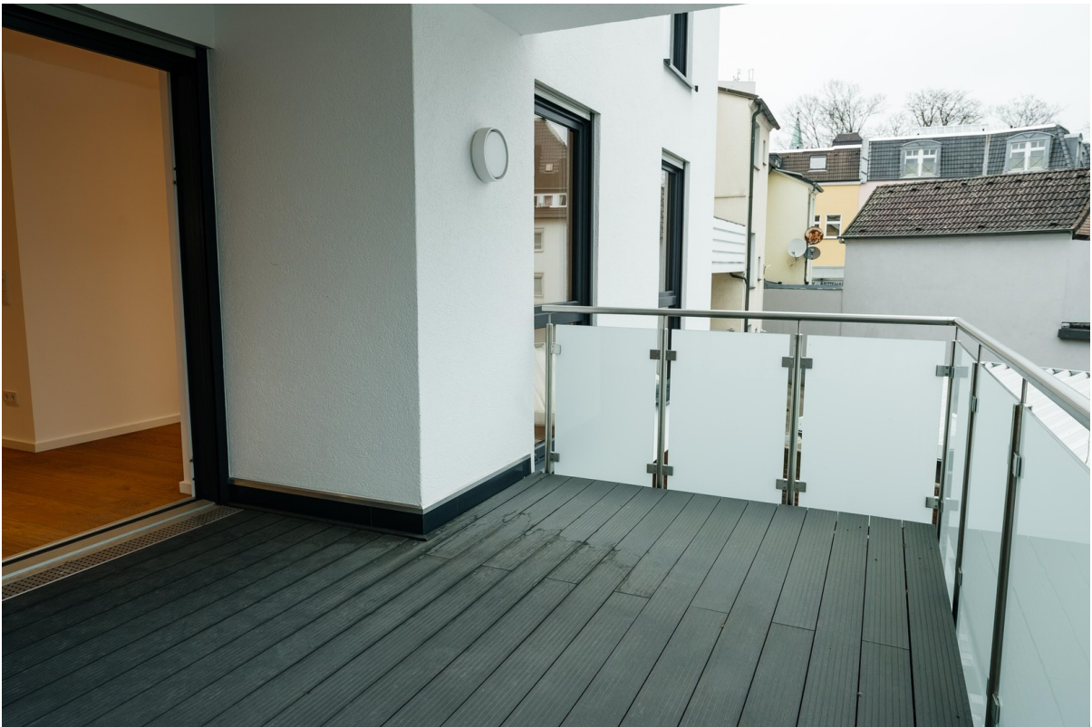
Balkon zum Hinterhof