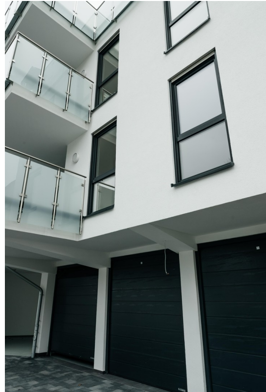
Hinterhof des Hauses