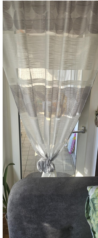
Wohnzimmer zum Balkon