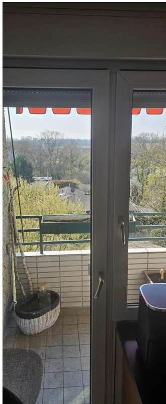
Blick aus der Küche