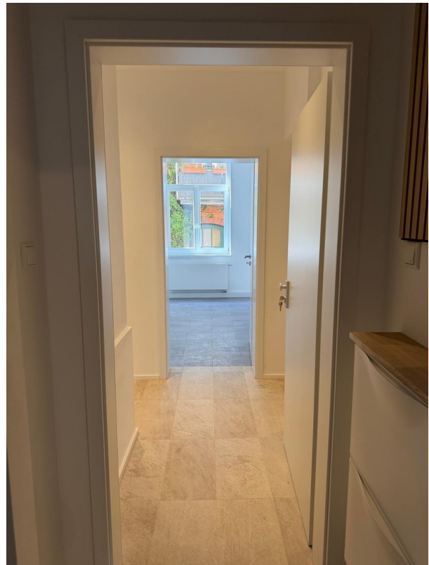
Zugang zur Wohnung