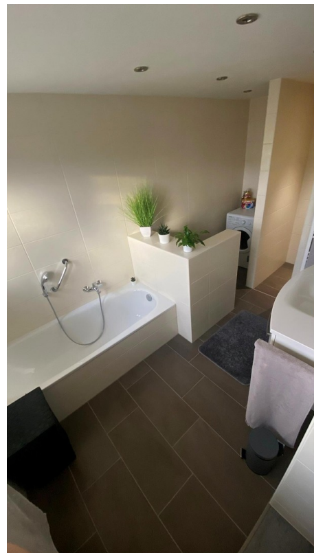
Bad mit Wanne/Dusche