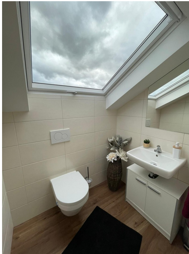
WC im DG