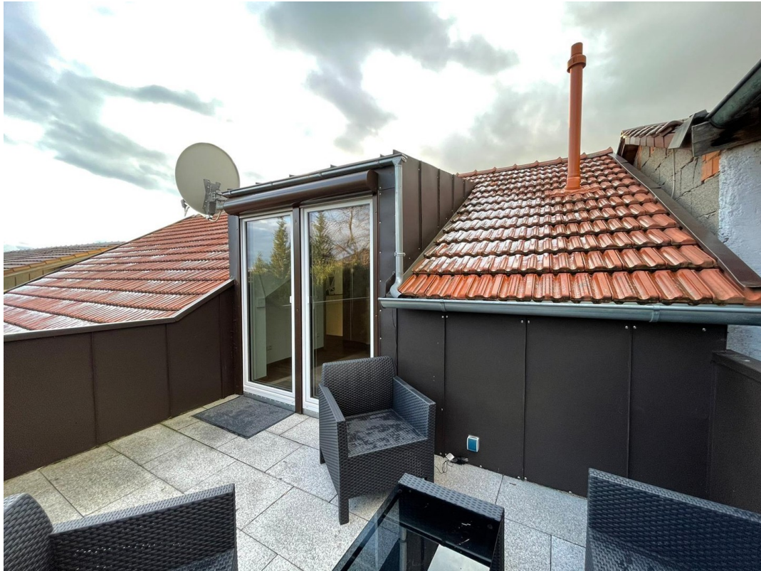
Terrasse Schlafzimmer 1