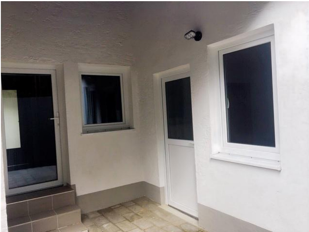
Zugang zur Küche/Abstellraum