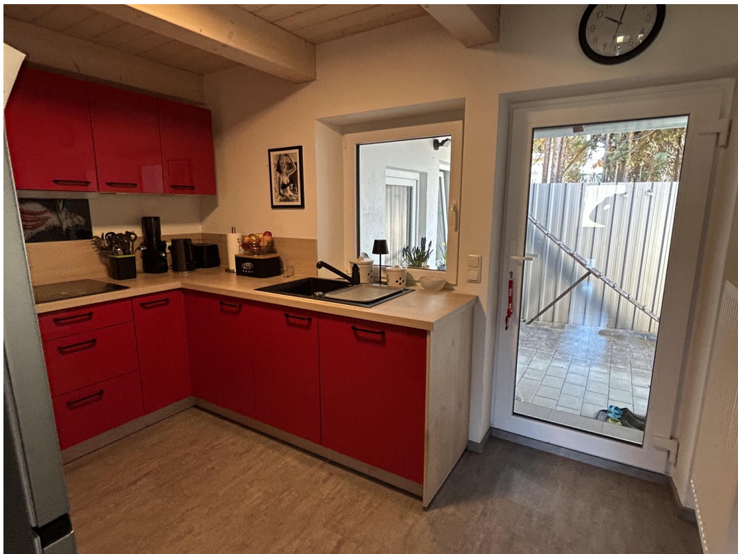
Küche mit Zugang zum Hinterhof