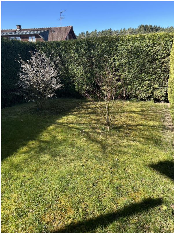
Garten zur Strassenseite