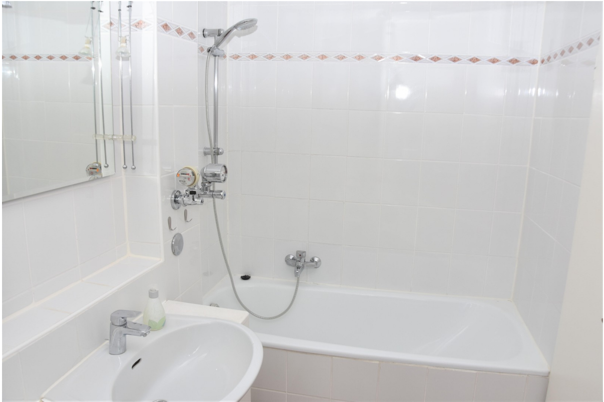
Schlafzimmer / Bad (ensuite)