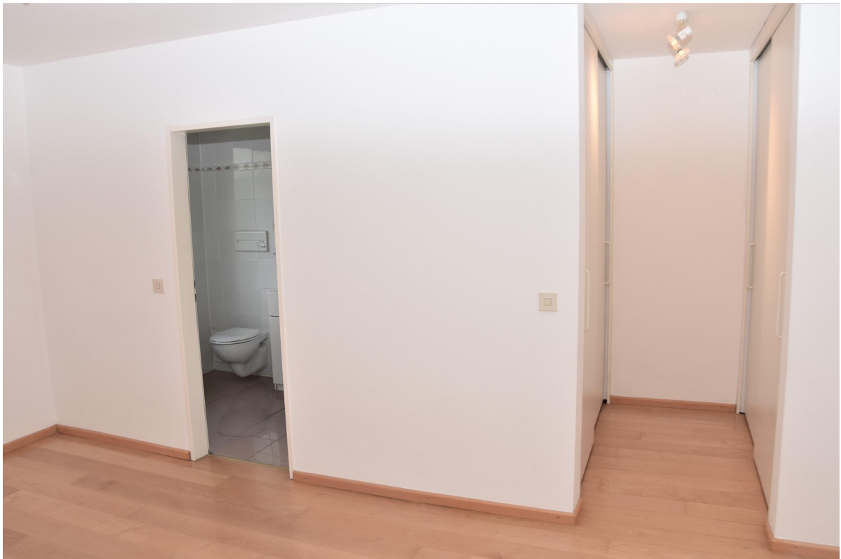
Schlafzimmer / Ankleide