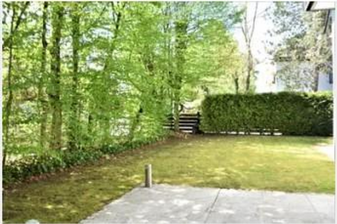
Garten / Terrasse (SW)