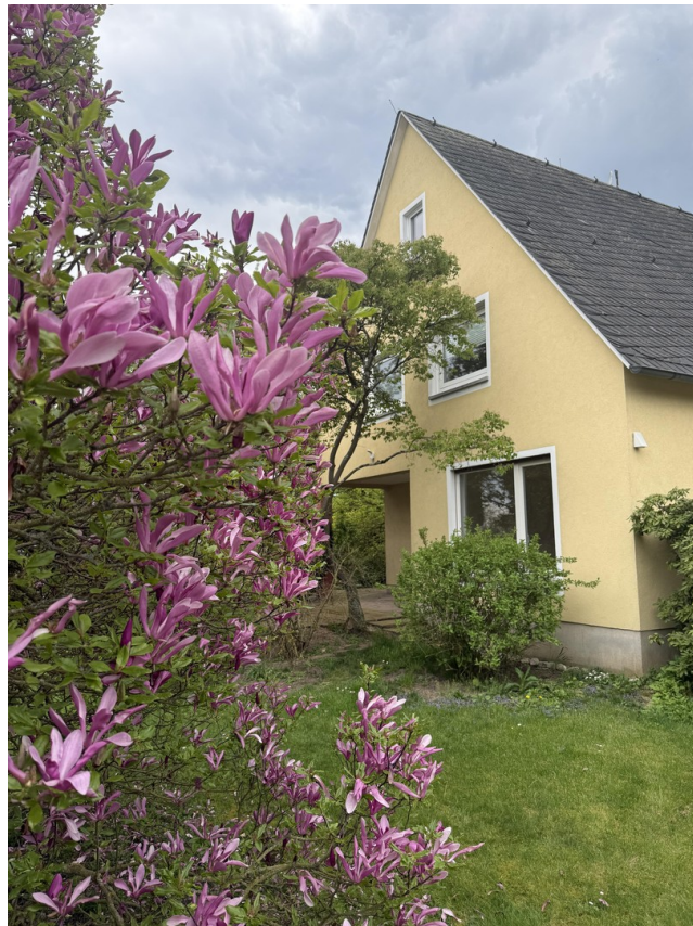
Blick auf Arbeitszimmer/Loggia