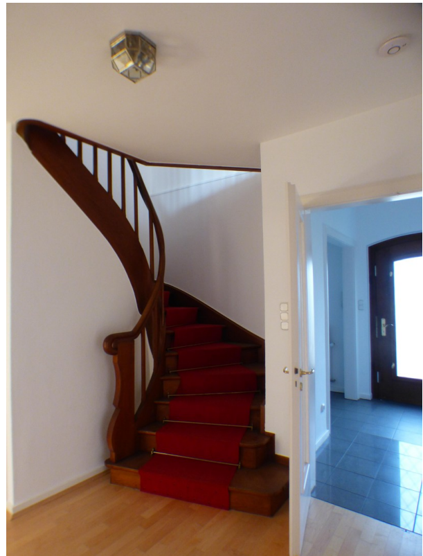
EG-Diele und Treppenaufgang