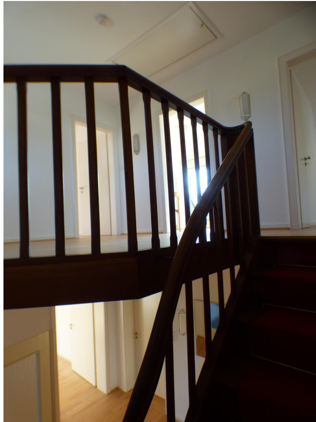
Treppenaufgang und Galerie