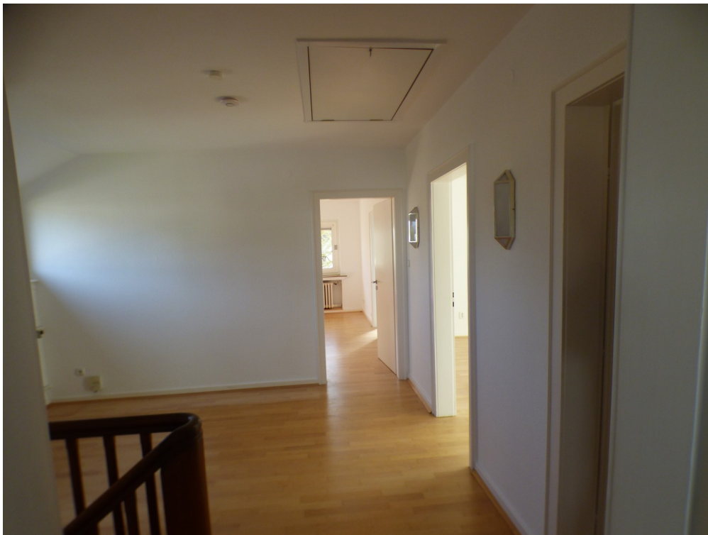
Diele im OG