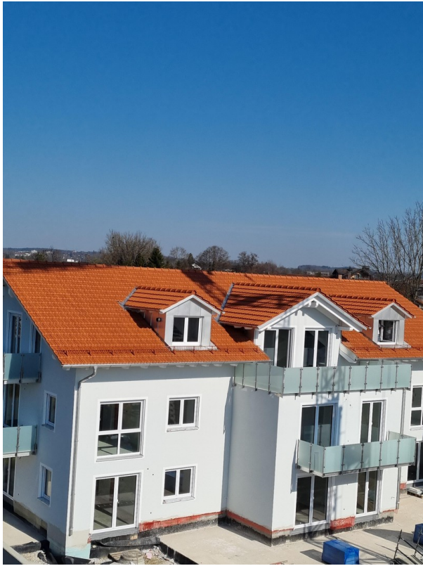
gr. Loggia Südseite m. Bergblick