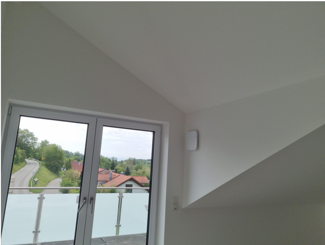
Bergblick aus Küchenbereich