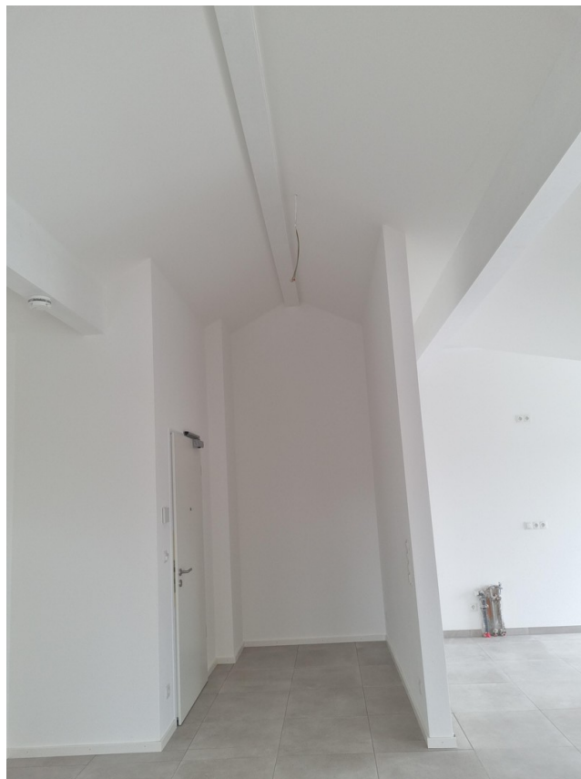
Eingangsbereich m. toller Höhe