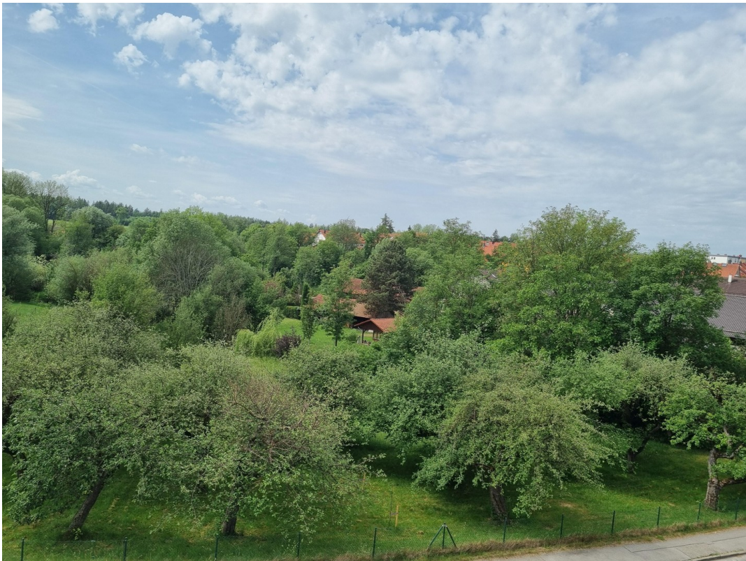
Blick vom Westbalkon