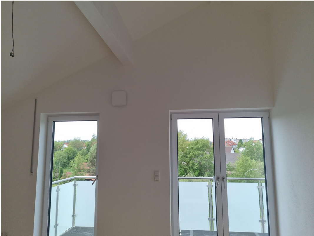
Blick vom Westbalkon