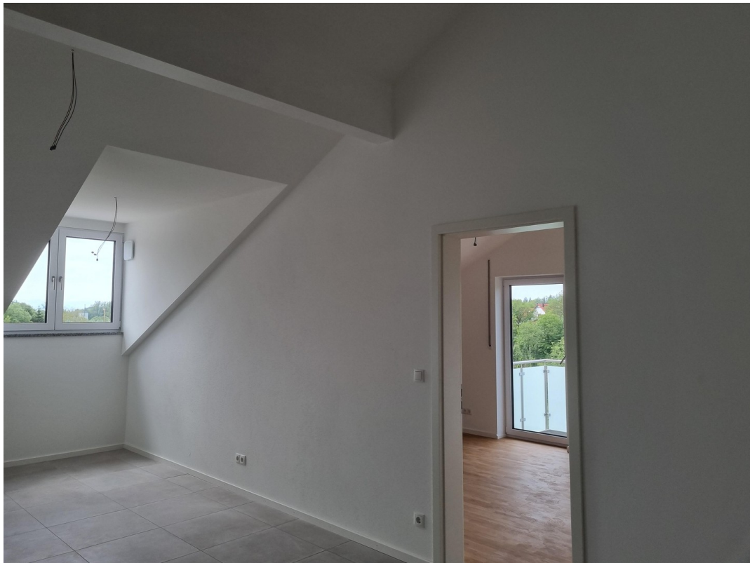
große Gauben im Wohnbereich