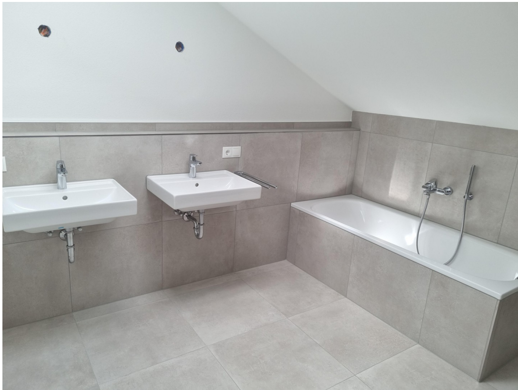
Bad 2 Waschtischen u. Badewanne