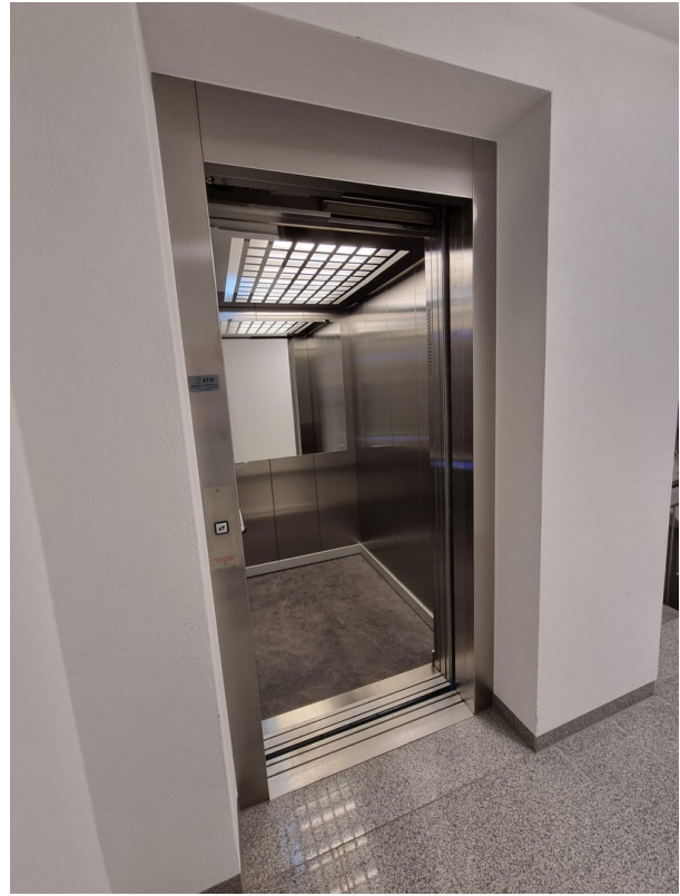
Aufzug v. TGa z. DG