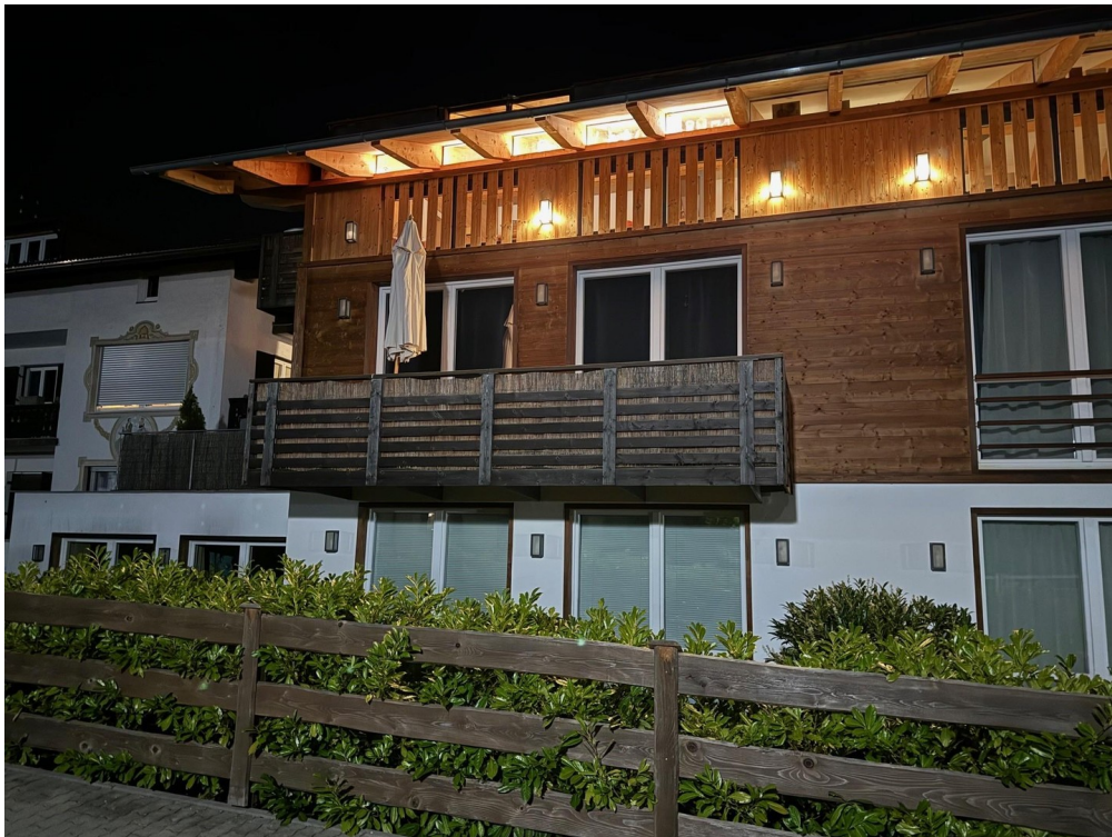
Süd - Balkon (1.OG)