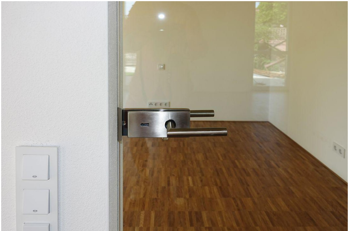
Innentüren sind aus Glas