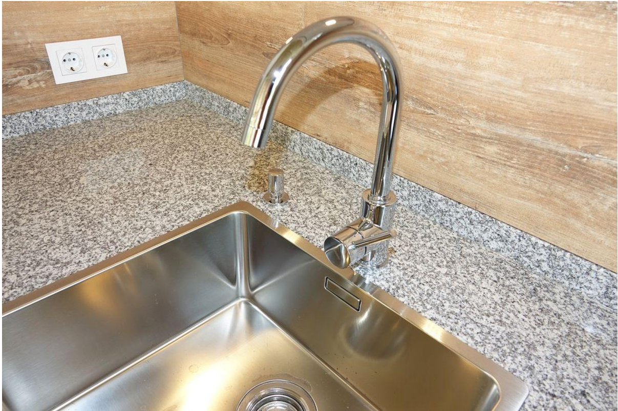
Detail Küche - Granitplatte