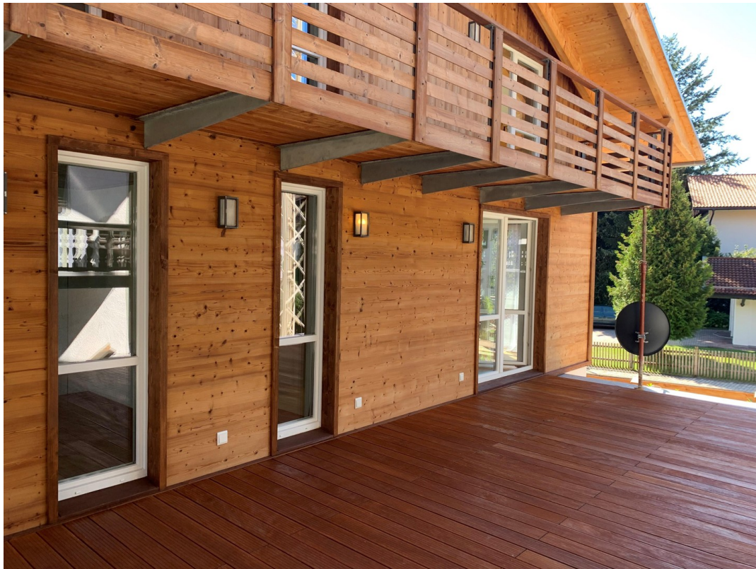
40 qm Süd / West - Terrasse