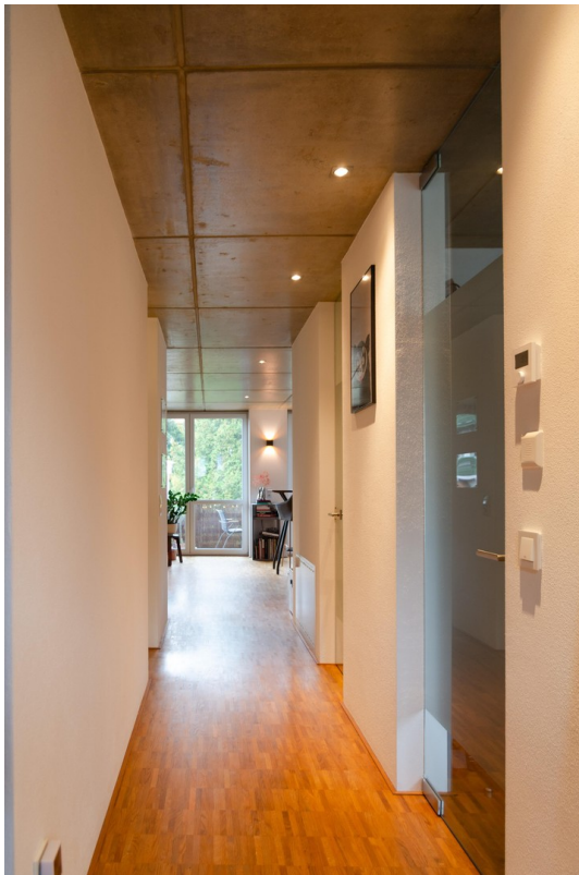
Flur / Gang