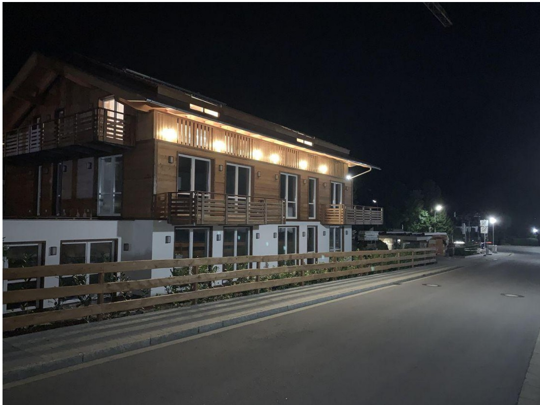
Ansicht von Süd / Westen