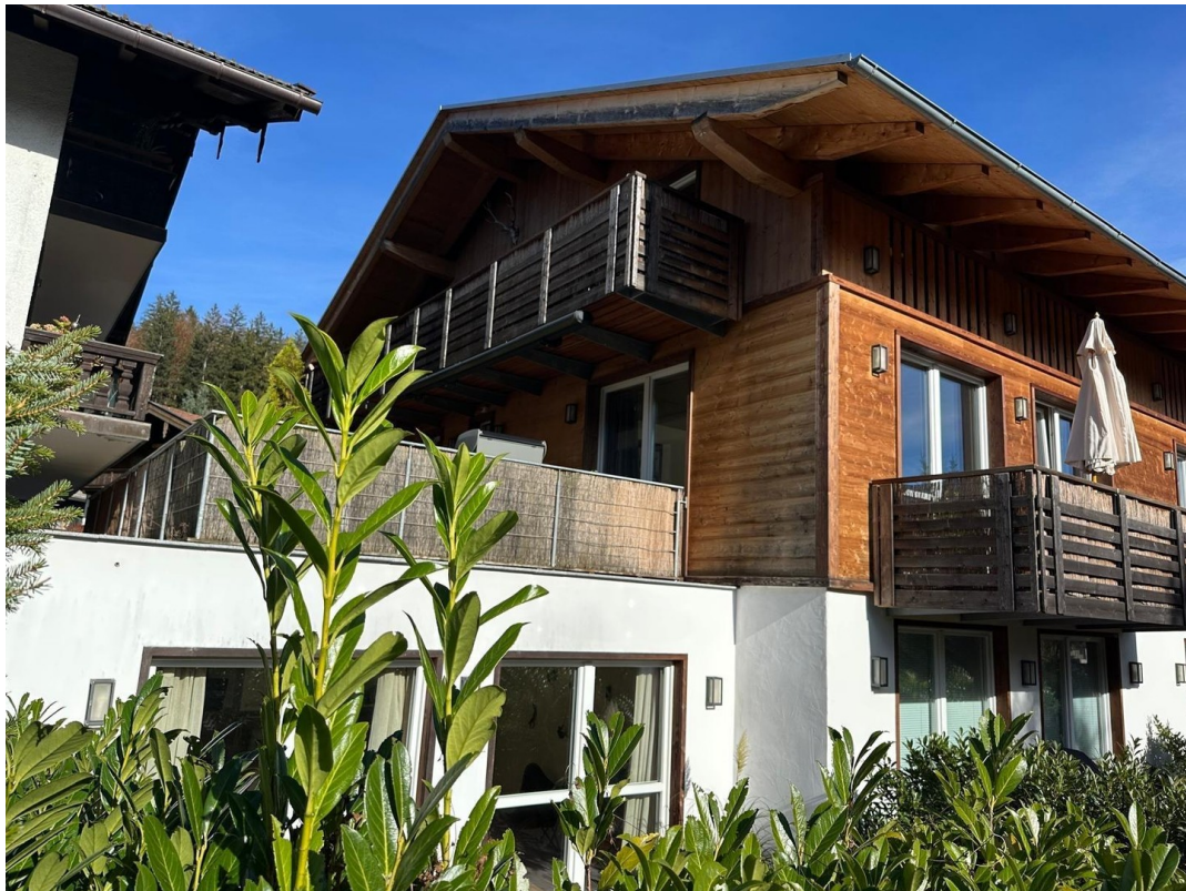
Terrasse und Süd - Balkon