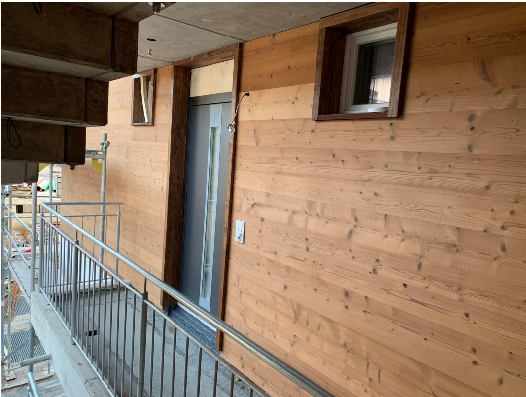
Situation am ETW - Eingang