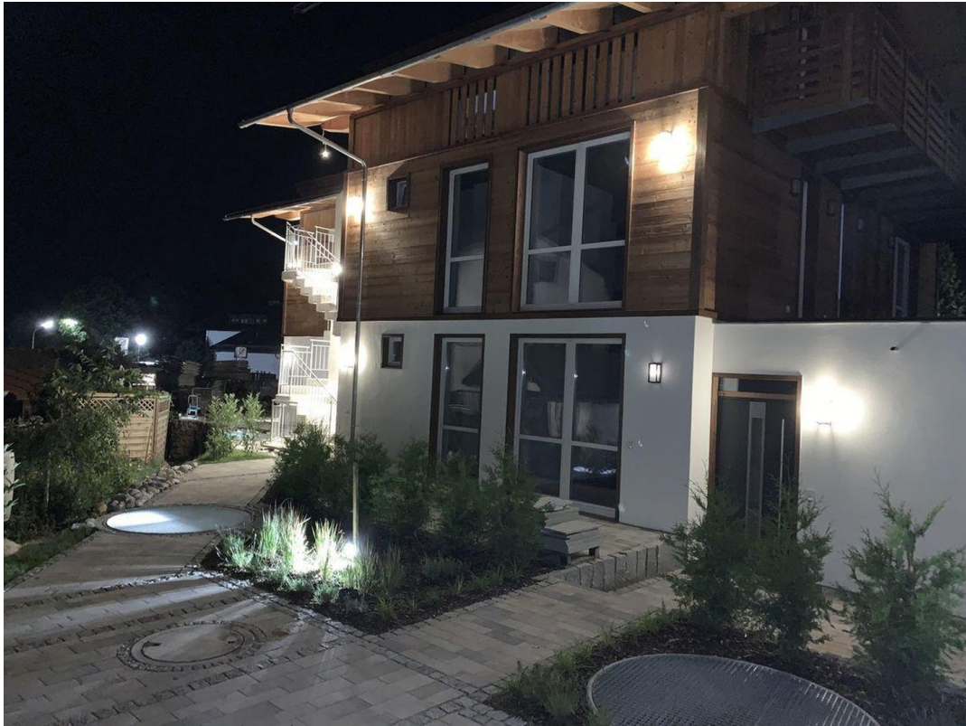
Innenhof Nord / Osten