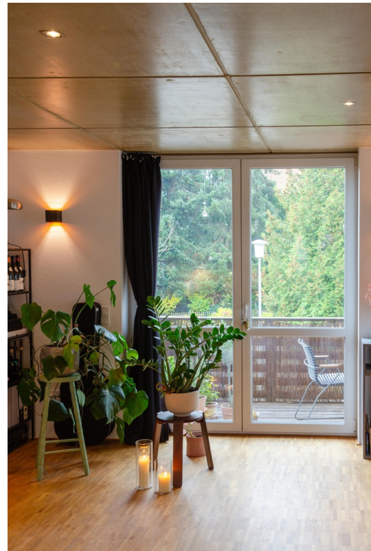
Wo-Zi. mit Blick auf Balkon