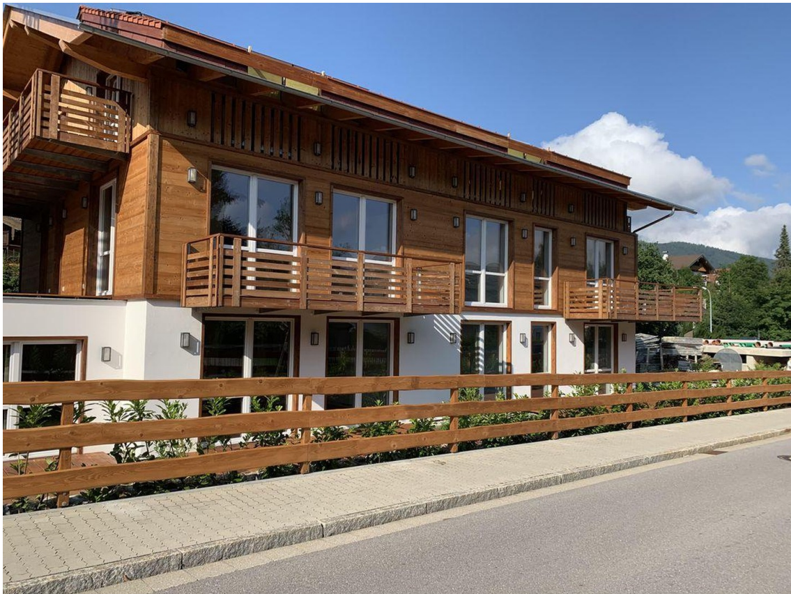
Ansicht von Süd / Westen