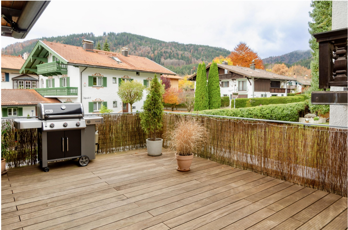
Süd / West Terrasse