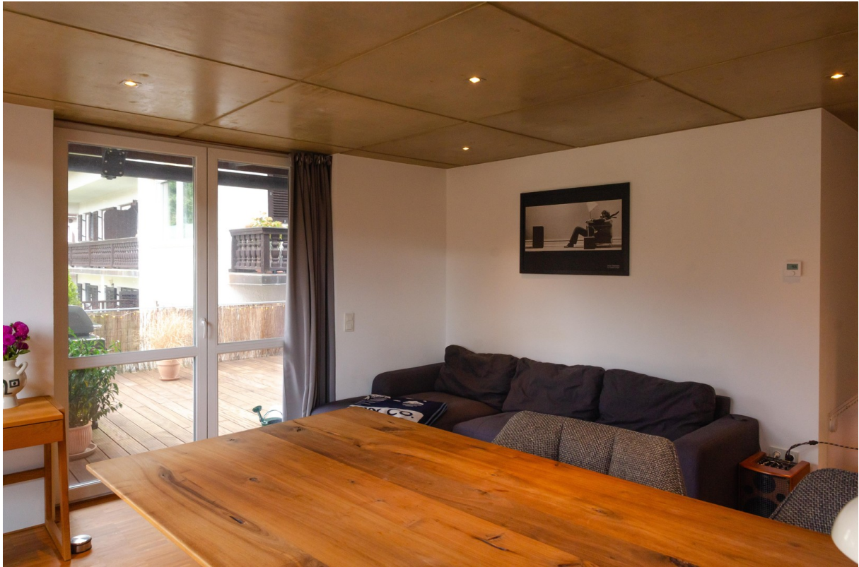
Wo-Zi. mit Blick auf Terrasse