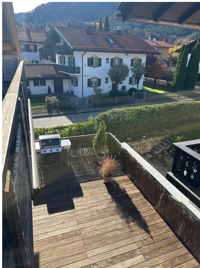
Terrasse von oben