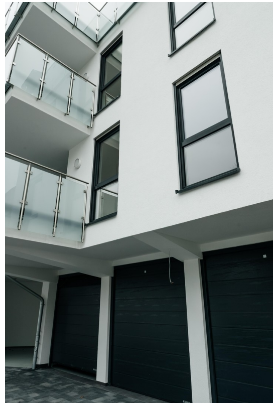
Hinterhof des Hauses