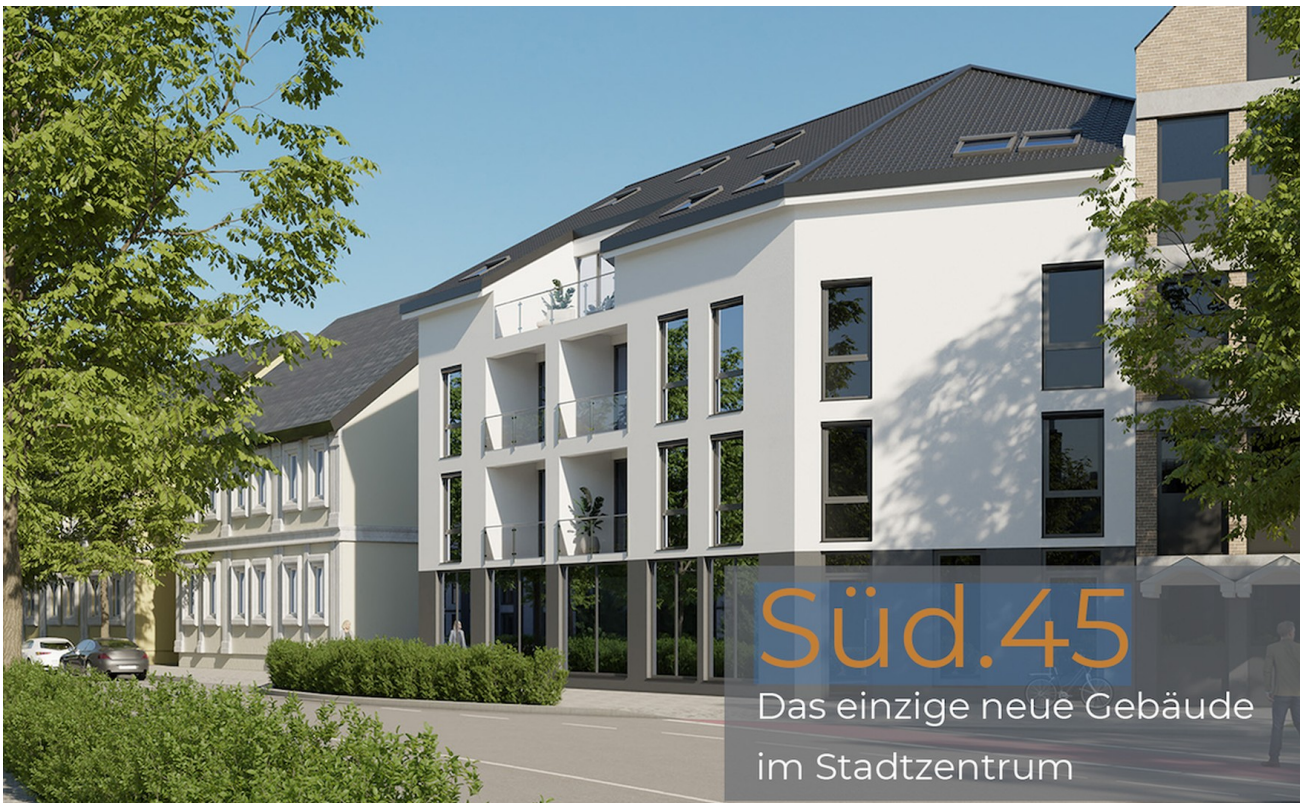
Strassenansicht des Hauses