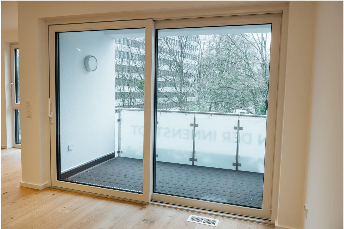
Zugang zum Balkon