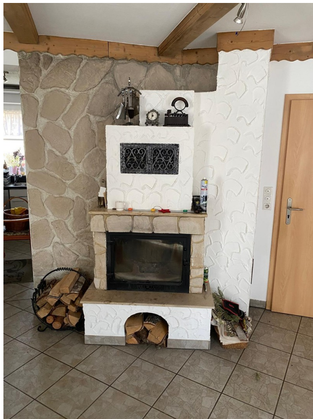
Kamin im Wohnzimmer