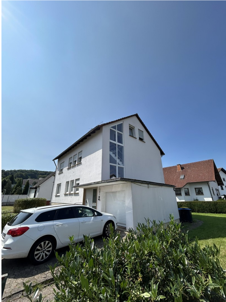
Ansicht mit Garage